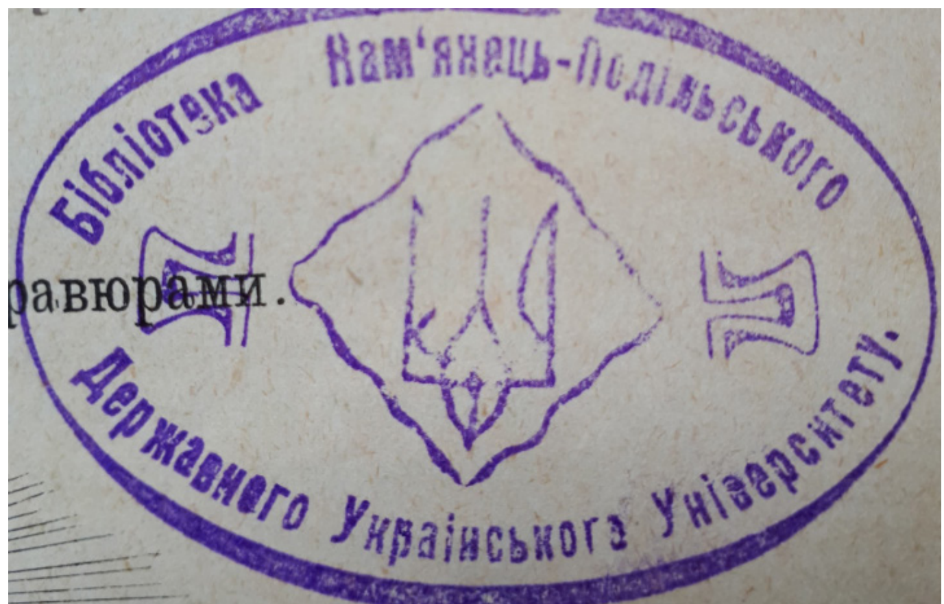
Рис. 2, 3