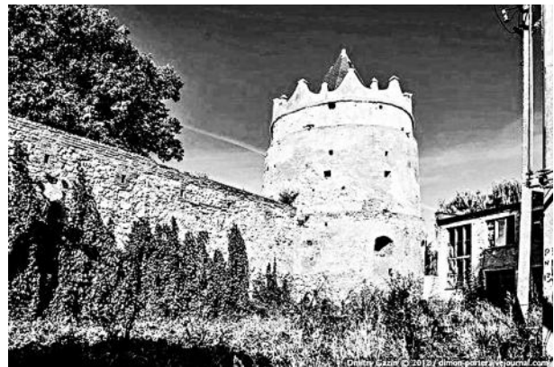
Рис. 4. Летичівський замок у 2012 році

В 1789 році старостою був Адам Казимир Чорторийський, в місті тоді було 137 християнських будинків та єврейських: в ринку 36 і затильних 39. На передмісті Замурному – 6 християнських будинків і на Заволоку – 47. Крім того, в місті знаходився замок, будинок суду, були також добре впорядковані мости та переправи. Князь Чорторийський вибудував тут нову вежу, яка вигідно оздоблювала місто. Скарг на старосту тоді не було, міщани жалілися лише на те, що в місці шинкарство і торгівлю прибрали до своїх рук євреї, «повидумували всякі оплати» (мостове, торгове тощо), вони ж не допускали будівництва