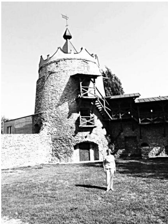
Рис. 5. Відреставрована вежа у Летичівському замку

1854 року костел згорів, проте його відновили за кошти парафіян та завдяки зусиллям о. Францішка Згерського. Летичів налічував 1864 року 5500 мешканців, 3 православних церкви, 35 мурованих будинків. Кількість міщан поступово зростала і в 1872 році в Летичеві було близько 6000 мешканців.