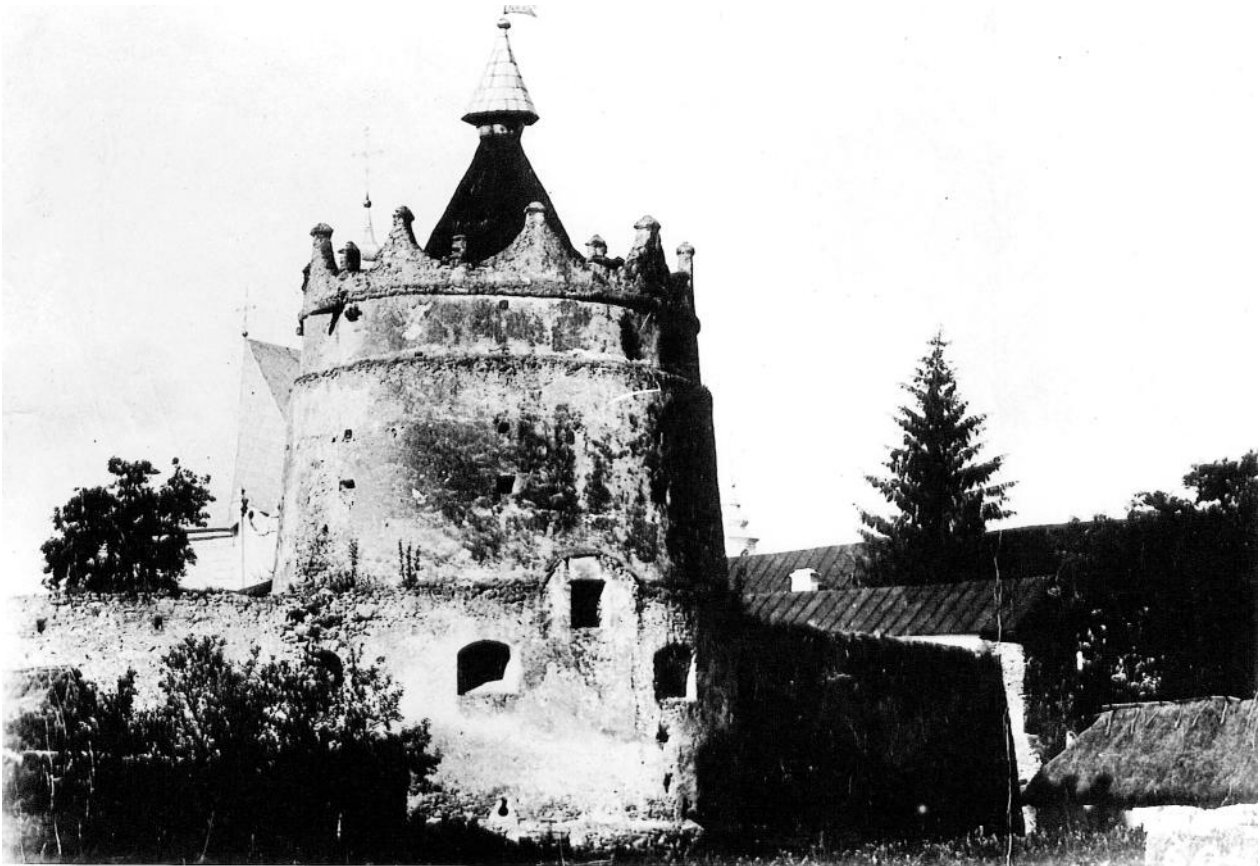
Рис. 1. Замок у Летичеві

У статті розповідається про історію будівництва та існування замку оборонного призначення у селищі Летичів Хмельницької області, який становить вагомий інтерес для розвитку туризму на Летичівщині.