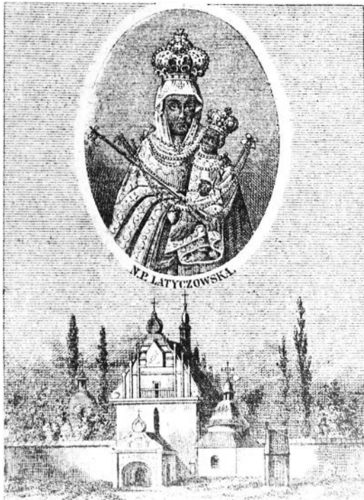
Рис. 2. Образ Матері Божої Летичівської

не тільки свою міць, але і красу. Гарно витесане вапнякове каміння, ретельно підібране, навіть під натиском найбільших руйнівників – часу і людської байдужості, а ще обстрілів, штурмів, перебудов. Його історія тісно переплетена з історією містечка та католицького костьолу – Санктуарію Летичівської богородиці.