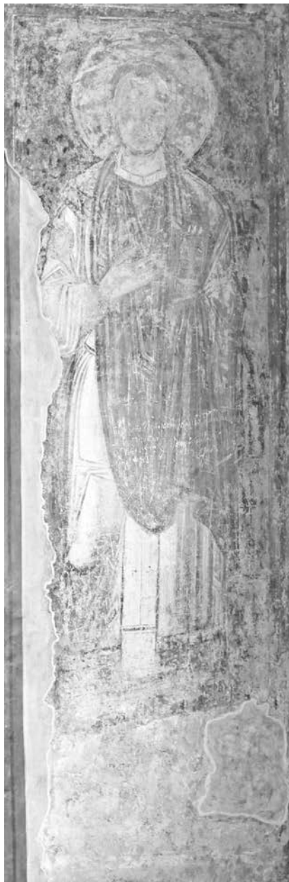
Мал. 2. Образ св. Козми в західній внутрішній галереї Софії Київської

Парним святим Козмі є Даміан, що дозволяє припустити наявність саме образу на протилежному виступі стіни, де фреска ХІ ст. не збереглася і де в ХІХ ст. був зображений св. Філарет. Таке розташування святих у цьому коопартименті є єдиним допустимим. Композиційно двоїця св. цілительів Козми та Даміана фланкувала перехід із західної внутрішньої галереї до приділа свв. Йоакима та Анни.