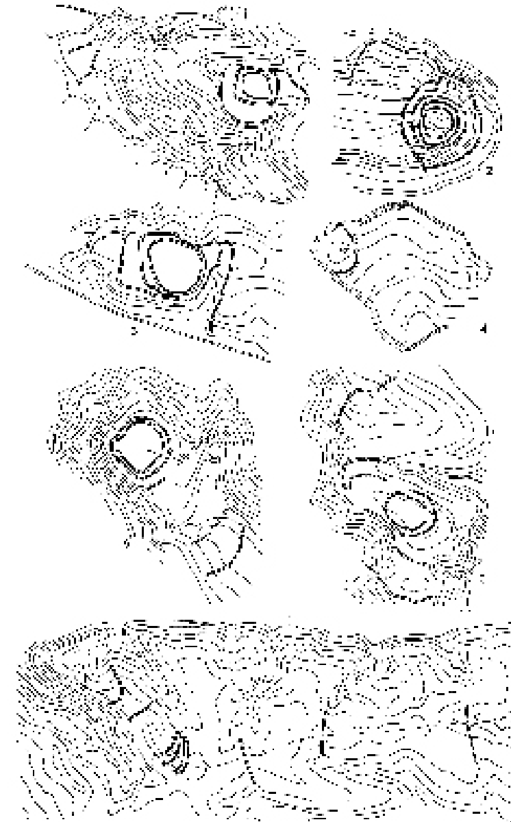
Рис. 2. Плани городищ Верхнього Подністров'я: 1 – Ганачівка, 2 – Гологірки, 3 – Добростани, 4 – Ступниця, 5 – Підгородище, 6 – Рокитне (Бірки), 7 Которини V