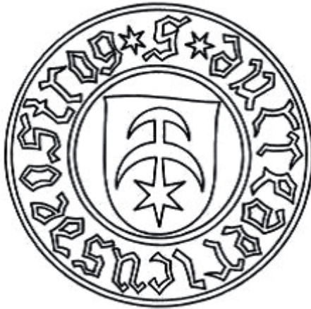
Пячатка Фрыдэрыка Фёдаравіча князя Астрожскага 1438 г. – Однороженко О. Геральдика князів Острозьких у світлі нововиявлених джерел // Антиквар. – № 5-6 (102). – Травень-червень, 2017. – С. 111.