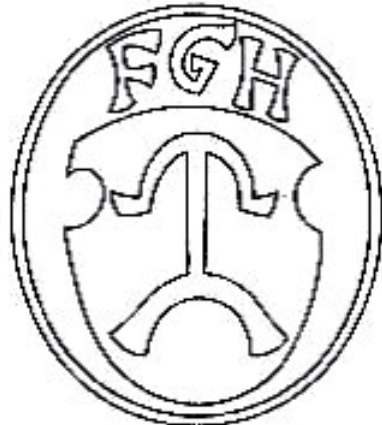
Пячатка князя Фёдара Пятровіча Галаўні-Астрожацкага 1551 г.