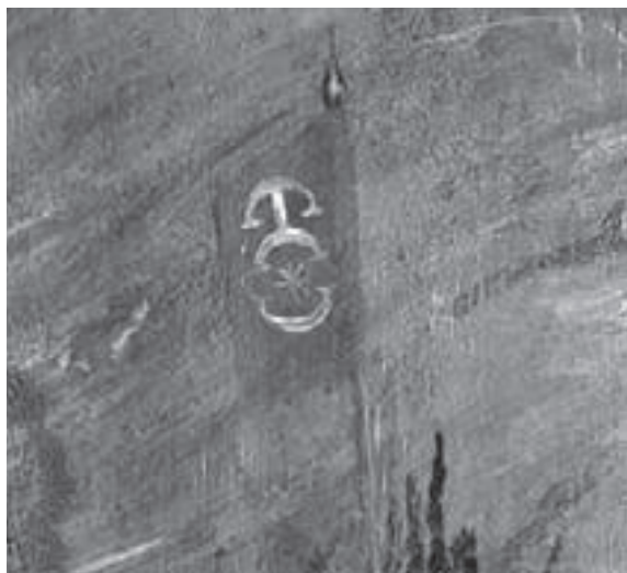
Вьява герба Канстанціна Астрожскага на карціне «Бітва пад Оршай».