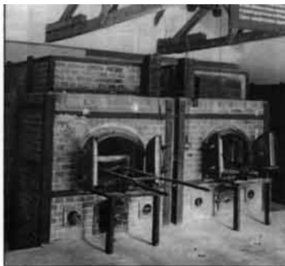
Two crematoria ovens: the number of Jewish corpses allegedly disposed of without trace, via such ovens, is improbably high