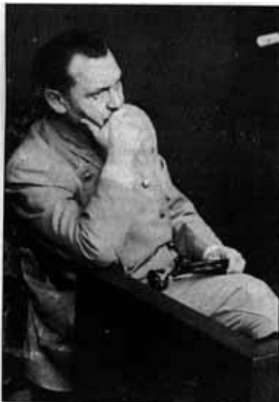
Hermann Goering at Nuremberg. He dismissed the Six Million accusation as propaganda fiction.

Ізраїль, в додаток до політичної мети, має велику матеріальну зацікавленість в цьому міфі про шість мільйонів. В книзі "Le Drame des juifs européens", стор.31,39, Рассіньє пише — "це всього лише метод, за допомогою якого Ізраїль отримує великі репарації від Німеччини, починаючи з 1953 р., однак з юридичної точки зору ці репарації не мають під собою підґрунтя, бо Ізраїль не існував на час війни і Німеччина не могла завдати шкоди державі, якої не існувало". І зрозуміло, якщо підстави для репарацій вельми сумнівні, то чим більше диму, тим більше здичавілих звинувачень, тим важче розібратися у ситуації. "Мабуть мені дозволять нагадати, що Ізраїль був заснований у травні 1948 р., а до цього жиди були громадянами інших держав. Щоб оцінити розмах цієї брехні, варто лише поглянути на ситуацію, де Німеччина платить Ізраїлю репарації з розрахунку шести мільйонів вбитих, але принаймні вісімдесят відсотків з тих "шести мільйонів" виявляється зовсім і не померли! А на додаток Німеччина продовжує платити репарації навіть після того, як чоловік, що подав вимогу про компенсацію, помер. Гроші у таких випадках надходять його спадкоємцям".