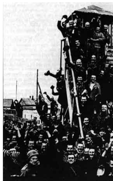
Healthy and cheerful inmates released from Dachau.