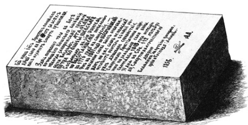
Зображення плити П.І. Калнишевського з книги «Запорожжя в залишках старовини і переказах народу»

Поверхня надгробної плити повністю заповнена вміло зробленим різьбленим написом. Численні дослідники