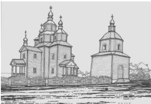
Зовнішній вигляд церкви та дзвіниці після оновлення 1818 р. з північного заходу. Прорис автора.

Першу постійну дерев'яну церкву в ім'я Архангела Михаїла з дозволу та благословення Київського, Галицького і Малої Росії Тимофія Щербаського було збудовано у Старому Кодаку в