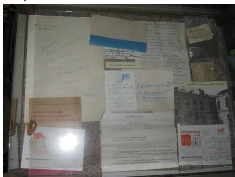
Фото-підбірка на стендах в кімнаті відображає життєвий і творчий шлях академіка.

У меморіальному музеї знайомимось з листом Нечкіної від 18 березня 1971 р., що надісланий з Москви.