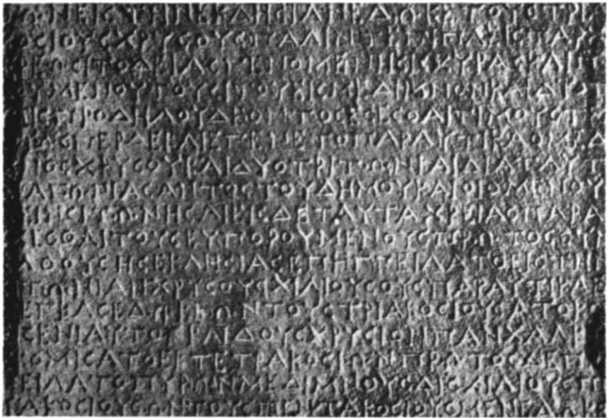
Рис. 1. Декрет на честь Протогена (деталь: бік А, рядки 57—73).

ту на честь Протогена за допомогою просопографічних даних приводить до того ж висновку, що й датування на підставі загальноісторичної обстановки: перша половина і середина III ст. до н. е. категорично виключаються, і треба уточнити час напису у межах останніх десятиріч III і перших десятиріч II ст. до н. е. Для цього слід зверну-