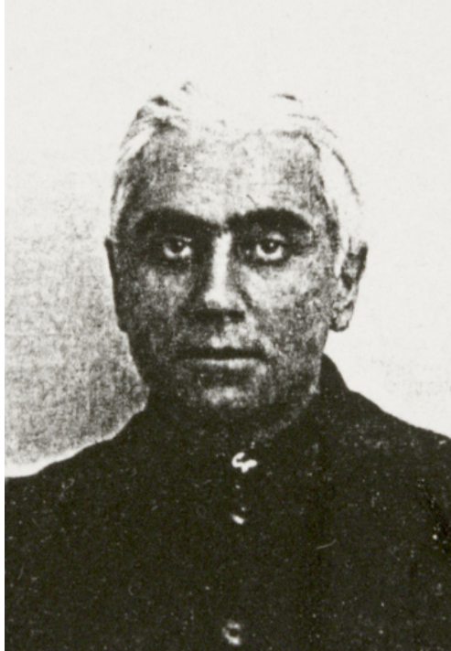
Ілля Семенович (Симонович) Вугман (1890–1964)