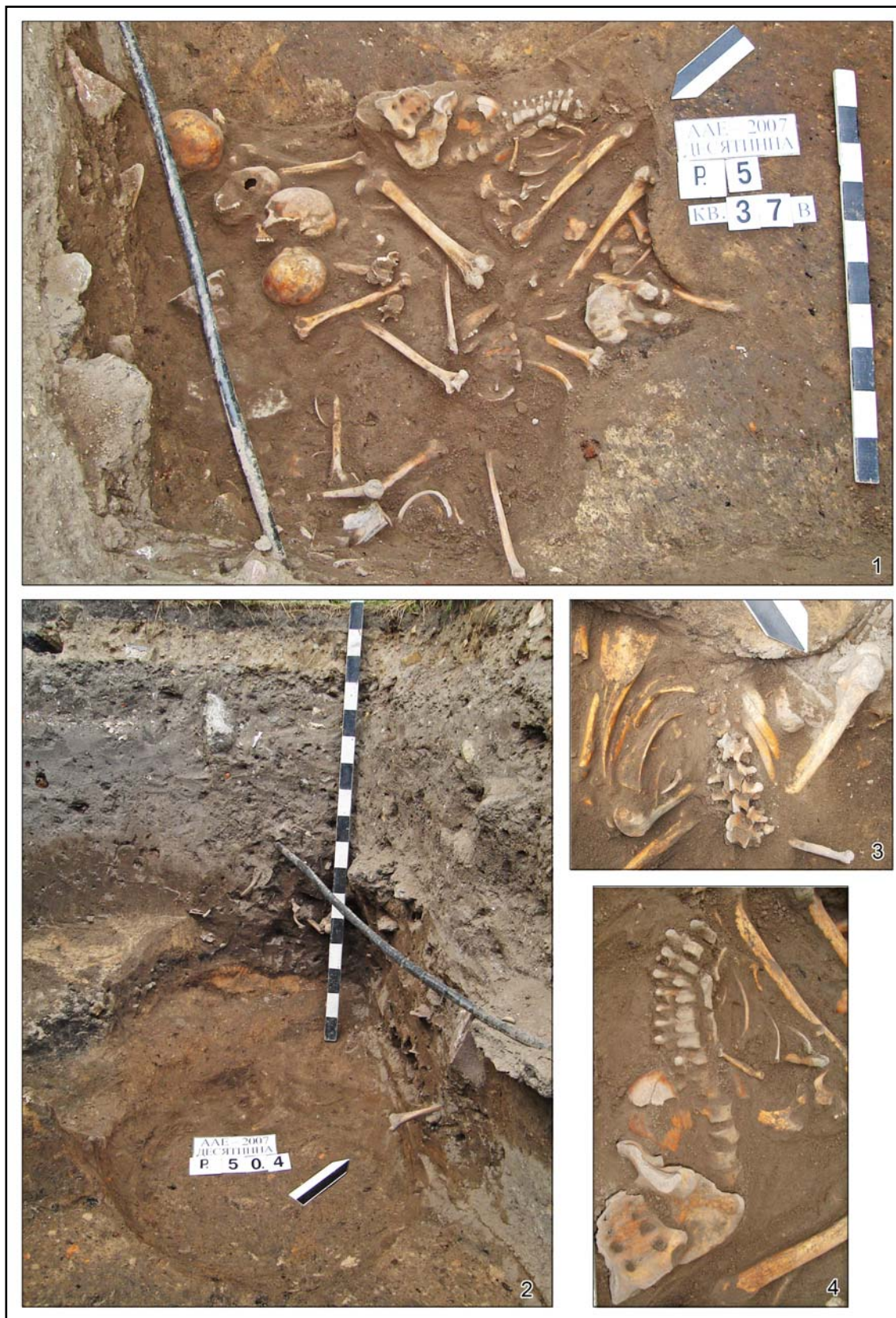
Рис. 3. Коллективная могила в объекте №4 (2007 г.) возле Десятинной церкви: 1 — уровень скопления костей; 2 — хозяйственная яма после выборки; 3, 4 — фрагменты костяков с сохранением анатомического порядка.