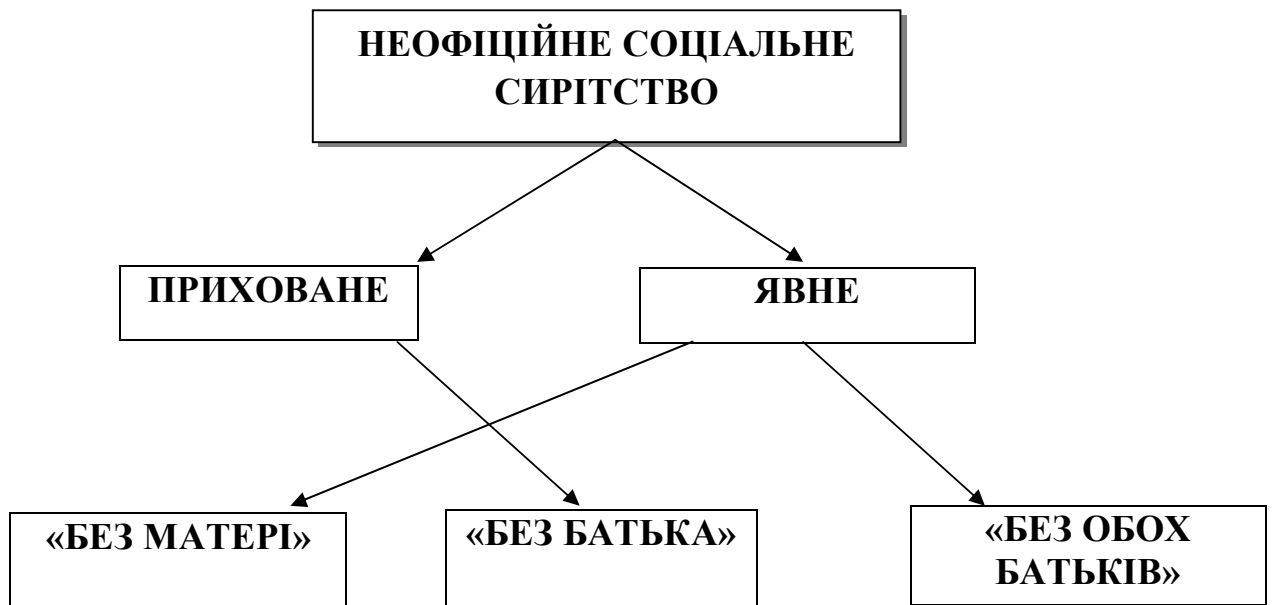
Рис. 3.1. Співвідношення моделей транснаціональної сім'ї з видами неофіційного соціального сирітства в контексті трудової міграції

Емпірично з'ясовано, як співставляються виділені моделі транснаціональної сім'ї в контекст міграції з виділеними видами неофіційного соціально сирітства (гіпотеза № 16 у Дод. Б) (див. Рис.3.1.)