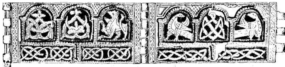
Браслет конца XII — начала XIII в. из клада, найденного в городе Ярослава (Киев)

ла появление у некоторых историков точки зрения о дальнейшей вражде и постоянных конфликтах Брячислава с Ярославом 46 . Однако для такой трактовки текста Воскресенской летописи нет оснований, так как источники в дальнейшем ничего не сообщают о столкновениях великого князя Руси с Полоцком. Скорее всего летописная фраза «воеваша Брячислав с великим князем Ярославом» означала союзнические отношения русских правителей. В пользу этого убедительно говорит материал Тверской летописи, в которой вышеизложенные сведения о мире Бря-