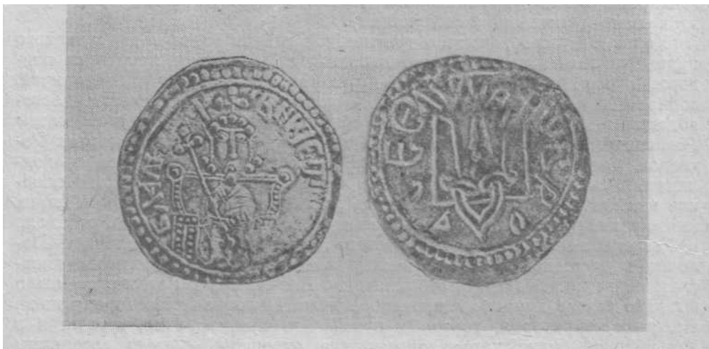
Сребреник князя Владимира Святославича

Прежде всего киевский князь начал преобразования в области религии. Существующая у восточных славян в рассматриваемое время языческая вера хотя и подверглась определенным изменениям по сравнению со славянскими верованиями родового строя, однако в конце