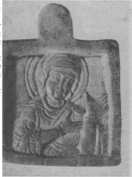
Каменная иконка с изображением богородицы Халкопратийской XII - начала XIII в. (Минск)