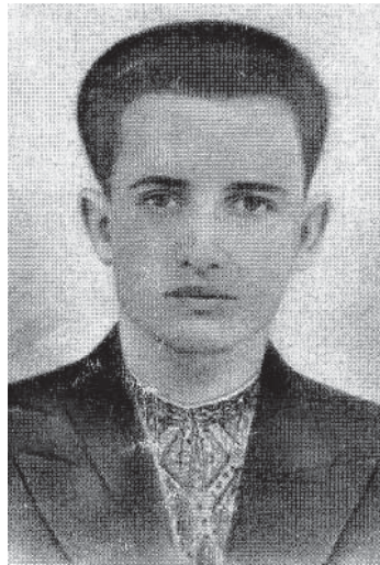
Бескид/Наливайко (Григорій Мот)