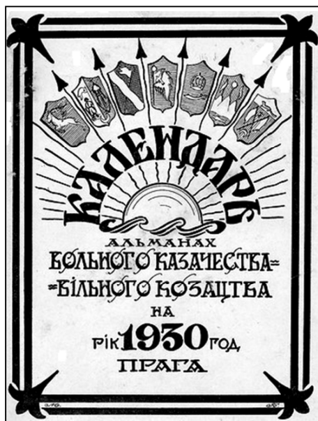
Рис. 4. Обкладинка календаря-альманаха на 1930 рік