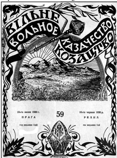
Рис. 1. Обкладинка часопису «Вольное Казачество – Вільне Козацтво» авторства М. Битинського