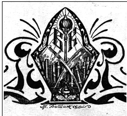
Рис. 2. Емблема часопису «Вольное Казачество – Вільне Козацтво»