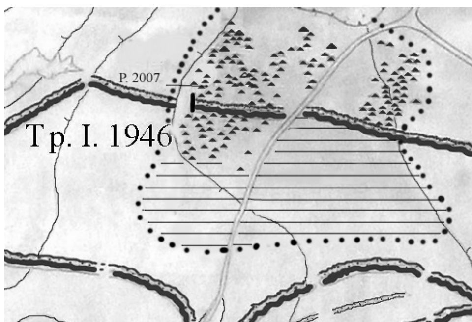
Рис. 3. План курганного могильника.