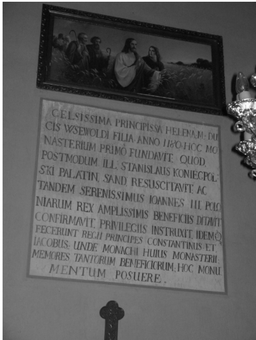
Рис. 4. Мармурова плита з написом про заснування Підгорецького монастиря.