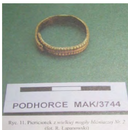
Рис. 5. Перстень з великої могили № 2 (за Р. Лівохом).