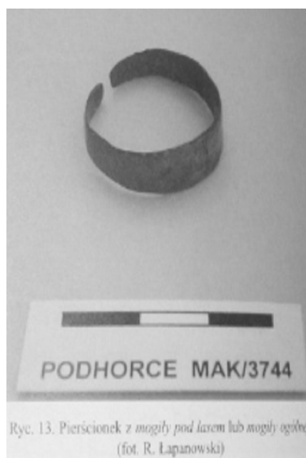
Рис. 6. Перстень з могили під валом або окремої могили (за Р. Лівохом).