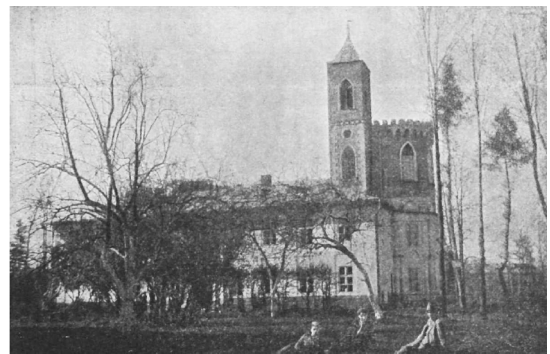
Іл. 4. Будівля суду південно-східний фасад. Фото публікувалося в книзі Я. Костовецької «З минулого Долини» (Долина, 1936 р.)

Суттєво доповнюють викладену вище інформацію два нововиявлені джерела, які досі не були введені у науковий обіг України.