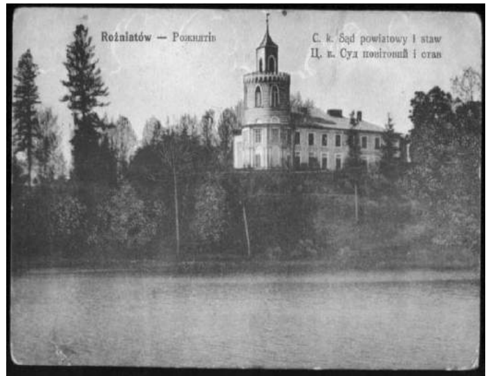
Іл. 2. Повітовий суд. Поштівка, 1909 р.

Починаючи з 1906 р. іконогорафічні, а з 1919 р. й літературні джерела фіксують інформацію про те, що палац Скарбека передано під повітовий суд [12] [17]. Після II світової війни будівлю реконструйовано: верхню частину вежі розібрали, зберігся лише фрагмент першого ярусу [22; 118]. Рішенням Івано-Франківського облвиконкому від 18 червня 1991 р. споруду взято під охорону як пам'ятку місцевого значення.