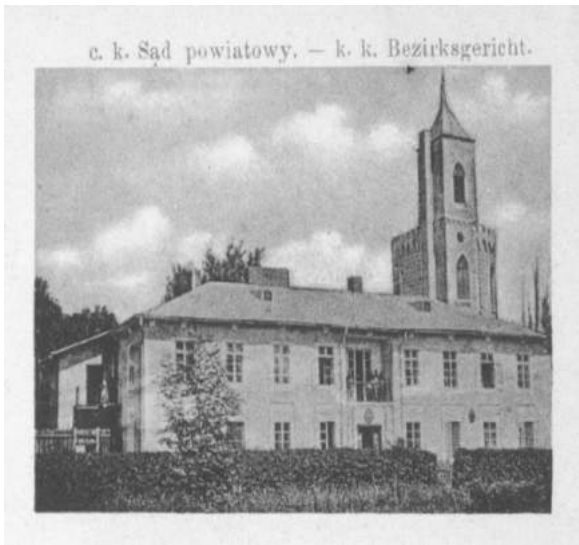
Іл. 1. Повітовий суд. Поштівка, 1906 р.

квадратну в плані вежу-донжон, що примикала до округлої башти з машикулями. На замковому подвір'ї садівники розбили великий дендрологічний парк [22; 119]. Час втрати оборонної функції, як і причини виїзду власників невідомі. Замок мав два підземні ходи: до урочища Батин і до Василянського монастиря. Один із ходів починався у вежі і вів у схил гори [21].