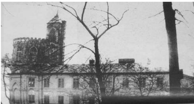
Іл. 3. Будівля суду північний фасад. 1930 р.

Починаючи з 1906 р. іконогорафічні, а з 1919 р. й літературні джерела фіксують інформацію про те, що палац Скарбека передано під повітовий суд [12] [17]. Після II світової війни будівлю реконструйовано: верхню частину вежі розібрали, зберігся лише фрагмент першого ярусу [22; 118]. Рішенням Івано-Франківського облвиконкому від 18 червня 1991 р. споруду взято під охорону як пам'ятку місцевого значення.