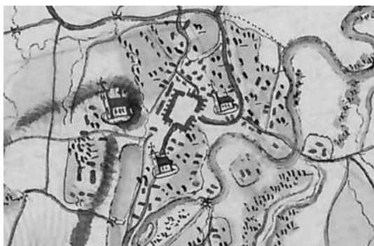
Іл. 6. Фрагмент карти фон Міга із зображенням містечка Рожнятова

дві церкви і косяль. Темною штриховкою показано стрімкі схили пагорба. Периметральних укріплень навколо замчища немає, однак ідентифікуються шість об'єктів замкового двору (міст, в'їзна брама, вежа, рондель, резиденція і синік) описані в інвентарі (іл. 7).