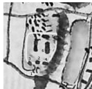
Іл. 7. Ідентифікація укріплень Рожнятівського замку відомих з інвентаря на карті фон Міга. Схема З. Федунківа

Друге джерело картографічне. Це карта відомого австрійського картографа Фрідріха фон Міга, видана у 1779-1782 рр. (масштаб 1 : 28 800) [1]. (іл. 6) Карта фон Міга 1779-1782 рр. зберігається в Австрійському військовому архіві у Відні. В Україні в науковий обіг карту ввела архітектор Галина Петришин [24]. У 2014 р. карту оцифровано і виставлено для загального огляду на сайті «mapire.eu» [10]. Різниця між появою на світ інвентаря і карти становить близько 25 років, тому обидва джерела взаємодоповнюють одне одного. На карті показано суцільну забудову прямокутної в плані Ринкової площі,