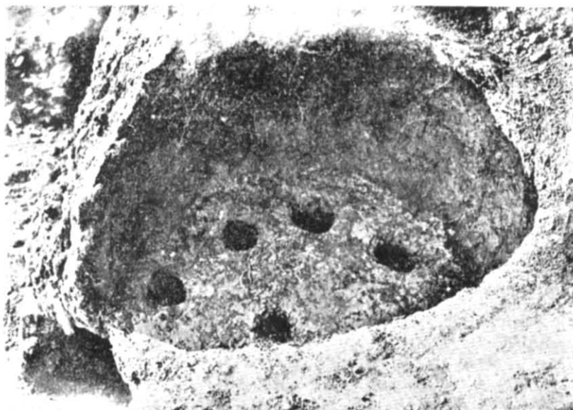
Фото 3. Ганчарське гарно № 3.