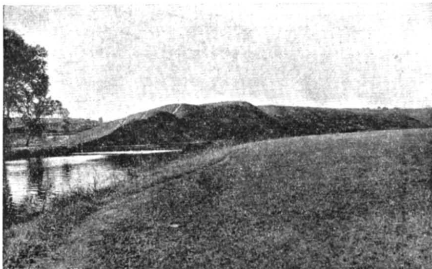
Фото 1. Краєвид на Донецьке Городище з лівого берега р. Ули.