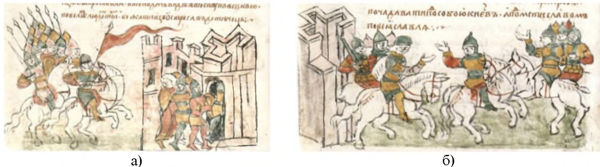
Рис. 13. Мініатюри Радзивилівського літопису: а) люди утікають від половців з острога до дитинця Чернігова (арк. 194 зв.); б) міжусобиця за участю половців 1155 р. (арк. 198 зв.)

Серед зображень оборонних споруд у РЛ привертають увагу об'єкти складної ламаної форми. Такі оборонні споруди зокрема зображено на мініатюрі з облогою половцями Чернігова “На ту же ноч(ь) Ізяслав, и Ростислав, и Всевол(о)дичь, видѣвше силу пол(о)вєцкую, повелѣш(а) людем тѣм бежати изо острога вѣ детинець” [2, с. 124] (рис. 13 а). Цим зображенням мініатюрист демонстрував складну систему дерево-земляних оборонних ліній Чернігова, в середині якої розташовувався дитинець. У сюжеті міжусобиці за участю половців 1155 р. ламаною стіною показано прикордонні дерево-земляні укріплення. Вони демонструють межу, з-поза якої на Русь прийшли іноплеменники [2, с. 127] (рис. 13 б).