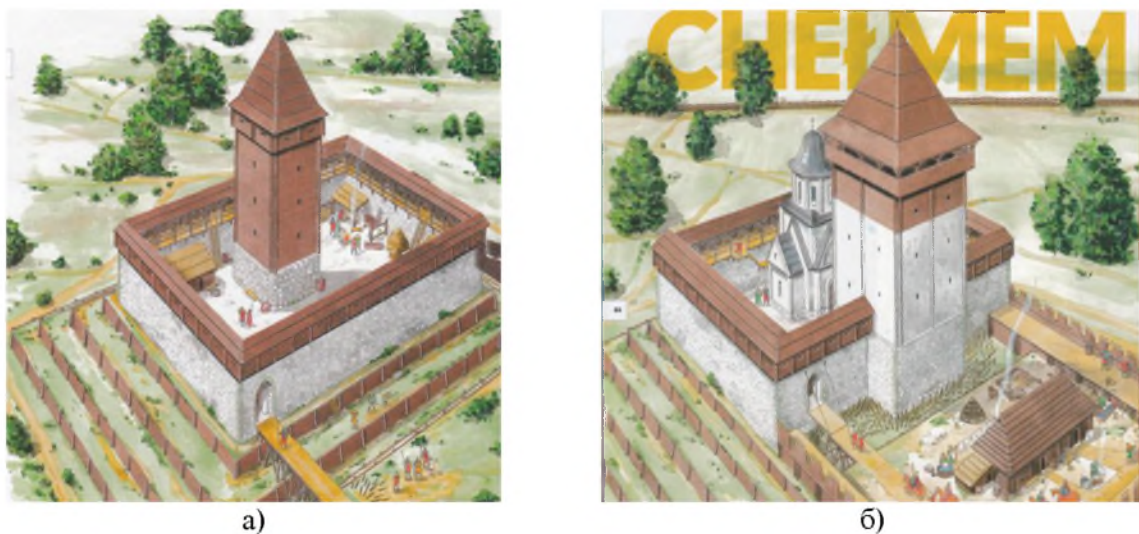
Рис. 16. “Городок малий” Данила Галицького у Холмі. Графічна реконструкція (за А. Венловським): а) перший етап будівництва; б) другий етап будівництва

Вірогідне волинське походження ілюмінованого протографа та його копії XV ст. (власне РЛ) дають ті географічні орієнтири, де слід шукати гóрод у прямокутних обрисах плану. І аналогія тут очевидна. Таким об’єктом є археологічно досліджений городок Данила Галицького на Гірці у Холмі із житлово-оборонною вежею, розташованою посередині північного прясла чотирикутника мурів (давніше – в його середині) (рис. 16 а, б). Прямокутні обриси плану мав укріплений монастир з кутовою вежею у Столп’ю. Такі об’єкти цілком могли слугувати прототипами зображень городів в мініатюрах РЛ, як з додатковими вежами, так і без них.