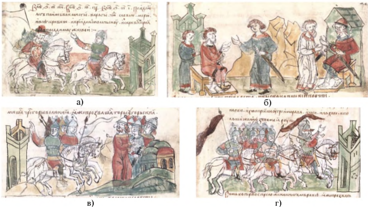
Рис. 7. Мініатюри Радзивилівського літопису:

Архаїзовані мініатюри без пізніх включень (де фігурують вежі з кутовими зубцями) також ілюструють розповіді про захоплення Олегом Смоленська та посадженням у ньому своїх мужів [2, с. 17] (рис. 7, а). Такі ж зображення фігурують у мініатюрі, що ілюструє переговори Олега (ватага якого видавала себе за купців) із Аскольдом та Діром у Києві [2, с. 17] (рис. 7, б). Так само Київ зображено в мініатюрі, яка ілюструє перехід угрів повз цей город, поблизу якого вони отаборилися та стали своїми вежами. Під вежами у цьому випадку слід розуміти переносні житла кочовиків. Ці вежі художник зобразив юртоподібними, зі заокругленими завершеннями [2, с. 18] (рис. 7, в). Наступне типово зображення “города” з кутовими зубцями мало б символізувати городи, захоплені уграми в Центральній Європі та на Балканах: “И начаша угре воевати на грекы, и поплениша землю Фрач(ь)ску, и Макидоньску, , даже и до Селуня. И начаша воевати на мораву и на чехы” [2, с. 18] (рис. 7, г) (“I стали воювати угри проти греків, і захотили вони землю Фракійську і Македонську, аж до [города] Солуня, і стали воювати проти моравів і проти чехів” [2, с. 14]).