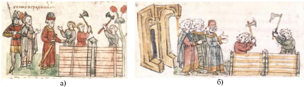
Рис. 2. Мініатюри Радзивилівського літопису: а) заснування Білгорода (арк. 67 зв.); б) заснування церкви Богородиці Пирогощі (арк. 164 зв.)

зображення зрубу слугувало не лише ілюстративним знаком міста, але й окремих будівель, зокрема хоромів (храмів). Незакінчений зруб означав процес будівництва.