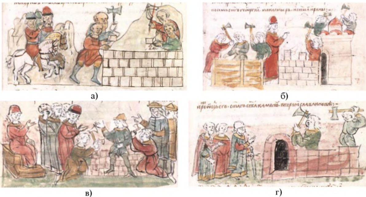
Рис. 3. Мініатюри Радзивилівського літопису: а) заснування церкви Богородиці у Тмуторокані (арк. 84); б) Ярослав закладає у Києві гóрод Ярослава з Золотими воротами та храми у ньому (арк. 87); в) заснування Успенського собору Києво-Печерської лаври (арк. 107 зв.); г) Андрій Боголюбський закінчив у Переяславі Суздальському церкву Спаса (арк. 202)

Зображення процесу будівництва гóрода чи споруди повторюється у мініатюрах РЛ й надалі. Але будівництво в дереві ілюструють лише два сюжети: 990 – князь Володимир Святославович засновує гóрод Білгород: “Заложи Бѣльгород и наруби во нь от иных городовъ, и многи люди введе во нь. Бѣ бо любя градъ сей” [2, с. 55] (рис. 2 а); 1131 – заснування в Києві церкви Богородиці Пирогощі: “В то же лѣто заложилъ Мстиславъ ц(е)рк(о)въ с(вя)тыя Б(о)г(оро)д(и)ци Пирогощу” [1, с. 107] (рис. 2 б).