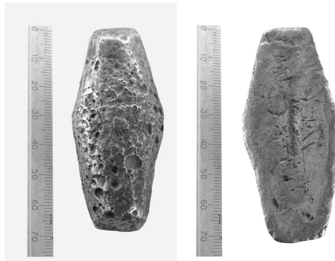
Рисунок 1. Нове надходження до нумізматичного зібрання НМІУ – монетна гривня київського типу. ТКВ-17958.

Порівняно зі взірцями з колекції НМІУ означена гривня коротша та вища, проте пере-