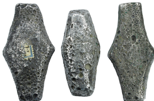
Рисунок 2. Порівняльна світлина монетних гривень київського типу з фондів НМІУ та досліджуваної гривні.

буває в допустимих вагових межах (рис. 2). Тому першочерговим є питання визначення автентичності нової гривні. Дослідження структури поверхні металу, характерних пошкоджень, вагових даних гривні дають підстави вважати її оригінальною. Проте під час дослідження цієї гривні виникли кілька питань.