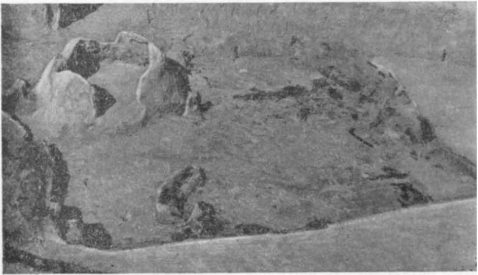
Рис. 3. Житло в західній частині городища.