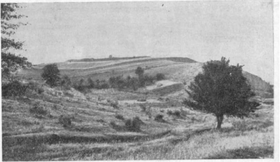
Рис. 1. Вид на городище із сходу.

а над рівнем площі городища — до 2 м. Найвища точка валу знаходиться в південно-західній частині дитинця — понад 4 м по зовнішньому схилу і близько 3 м від рівня площі городища. За валом проходить рів, який погано зберігся. В південно-західній стороні дитинця в лінії валу й рову є розрив; певно, тут знаходився в'їзд до дитинця. Друга, зовнішня лінія валу й рову, яка захищає кромний град, також добре збереглася, але вал тут має меншу висоту; в місцях, що най-