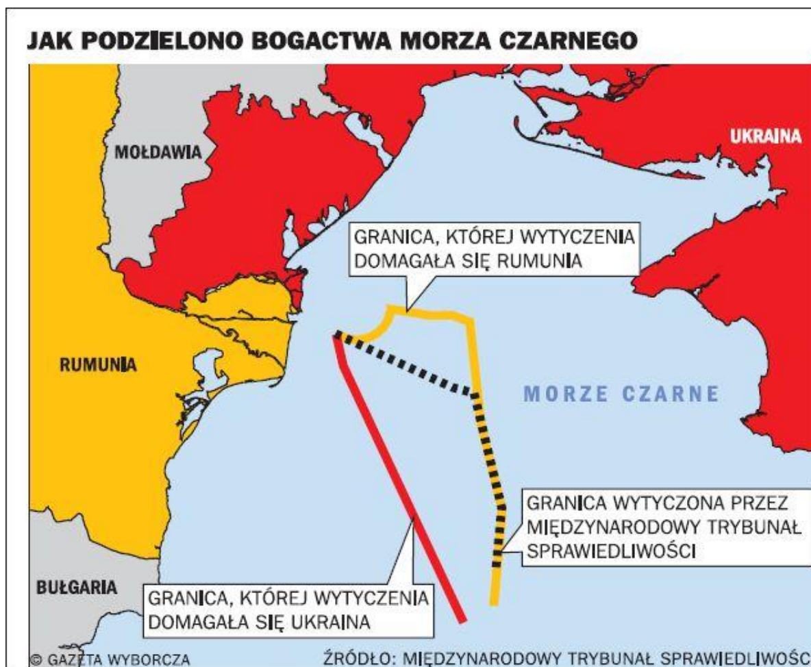
Załącznik nr 1. Podział bogactw Morza Czarnego – stanowiska Ukrainy, Rumunii oraz werdykt Międzynarodowego Trybunału Sprawiedliwości ONZ w Hadze