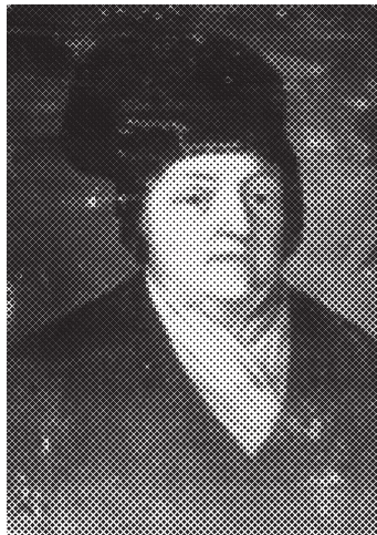
Ил. 3. Худ. А.С. Полуботок. [Автопортрет?]. Портрет Анастасії Степанівни Полуботок. 1802 р. П., о. 50х48. НМІУ. Інв № М-74. З родинної збірки Милорадовичів.