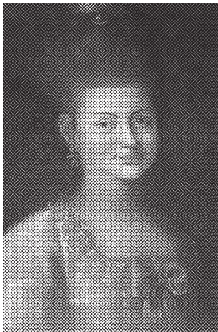
Ил. 2. Невідомий художник. Портрет Марії Павлівни Сулими. Після 1790 р. П., о. 65,5х51. НХМУ. Інв. № Ж-1141. З родинної збірки Сулим.