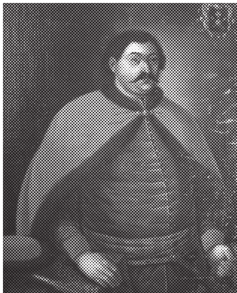
Ил. 4. Невідомий художник. Портрет Павла Леонтієвича Полуботка. XVIII ст. П., о. 122,5х93,5. Інв. № НХМУ Ж-796. З кінця XVIII ст. потрапив до Сулімівської родинної збірки.