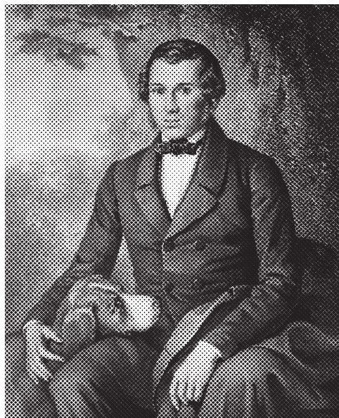
Ил. 5. Худ. А.М. Мокрицький. Гравер П. Борель. Портрет Євгена Гребінки. ІР НБУВ. — Ф. 1. — Спр. 70260. — Арк. 70.