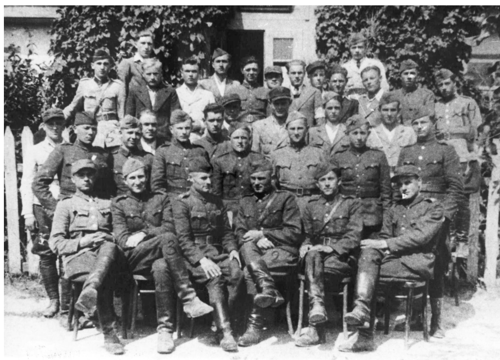
Групове фото службовців районної і сільської поліції, генеральна округа Волинь-Поділля, 1942 р.