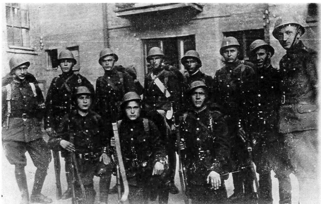
Службовці 115 шуцбатальйону у бойовому спорядженні, Київ, 1942 р.