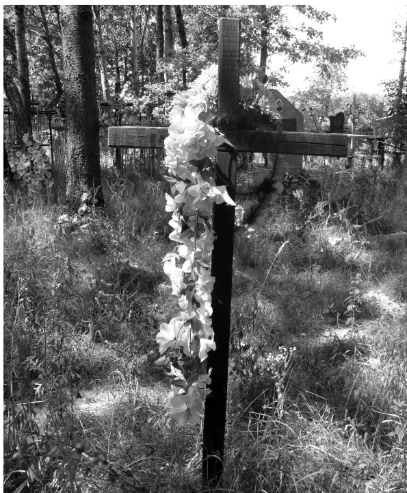
Могила безіменного «східного добровольця» в одному з сіл Київщини: селяни підібрали тіло після бою і поховали на своєму кладовищі. Напис на хресті – «Невідомий солдат» (фото автора, 2008 р.).

Джерела ілюстрацій: ГДА СБУ; ЦДКФФА ім. Пшеничного; Bessarabien, Ukraine, Krim – Der Siegeszug Deutscher und Rumaenischer Truppen. Ein Bilderbuch. – Berlin, Verlag Erich Zander, 1943; Solarz J. Armia Wlasowa. – Warszawa, Wydawnictwo Militaria, 2002; Білак О. Фрагмент з історії Буковинського куреня ім. Т. Шевченка. 1941-1944. – (Рукопис), [Б.м.], 2005; wikipedia.org.