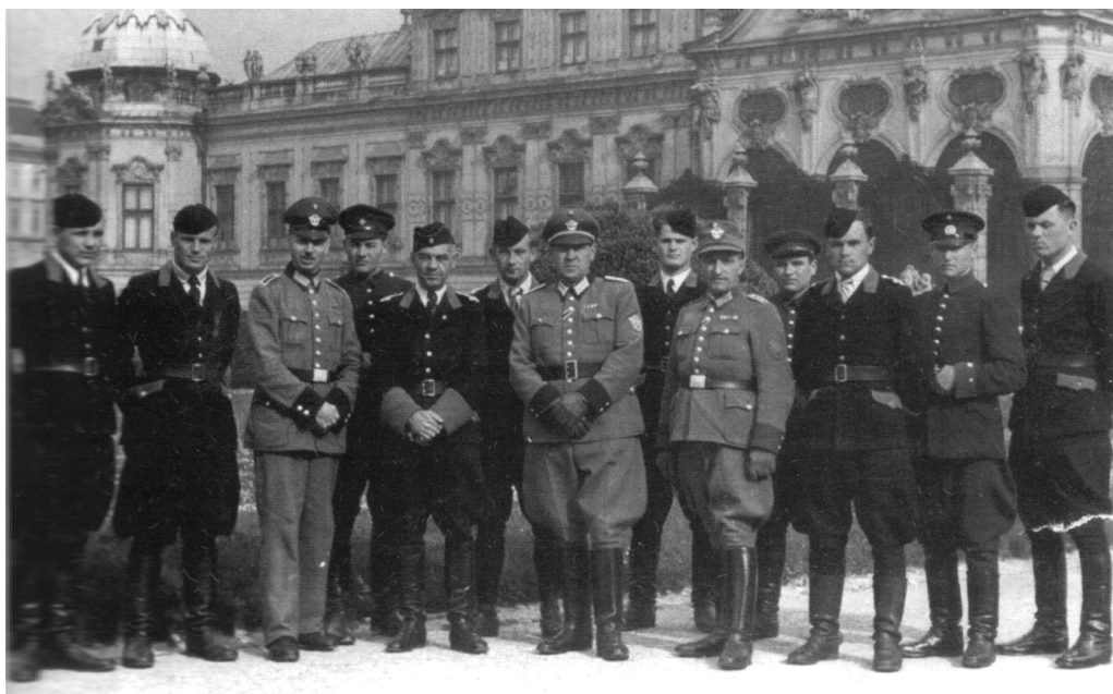
Офіцери і солдати 116 шуцбатальйону (в чорних одностроях) на екскурсії в Німеччині, 1943 р.