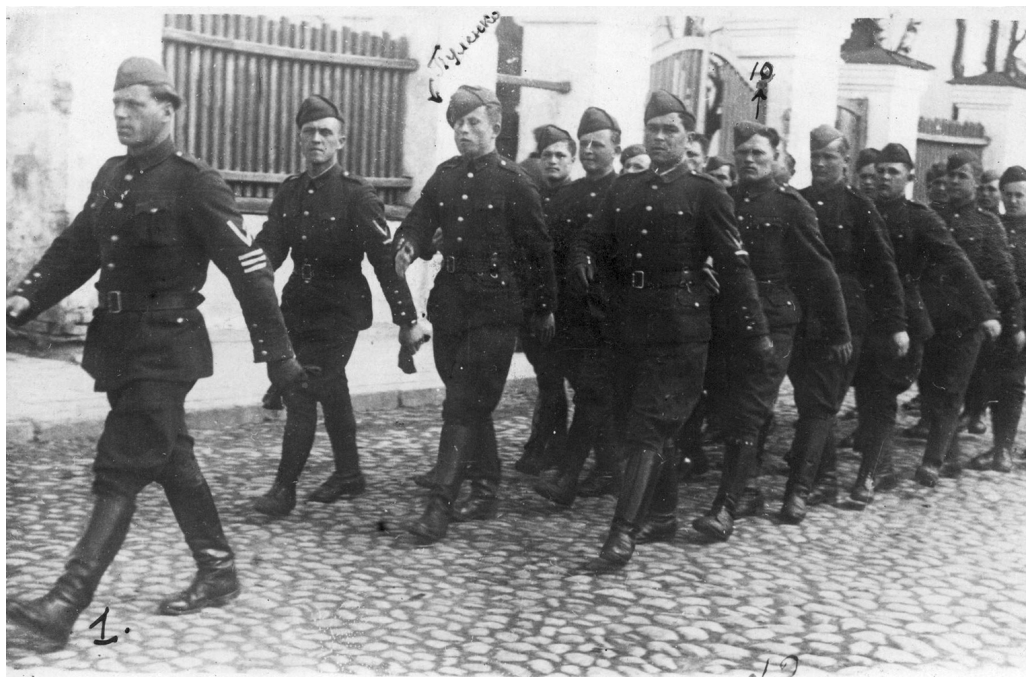
Колона службовців поліції в Києві на етапі формування перших батальйонів шуцманшафту, 1942 р.