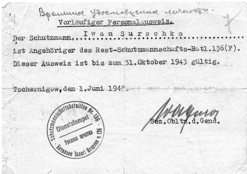
Тимчасове посвідчення солдата із решток 136 шуцбатальйону, якому, після виведення з боїв на Сумщині, присвоєно статус «польового» (F), 1943 р.