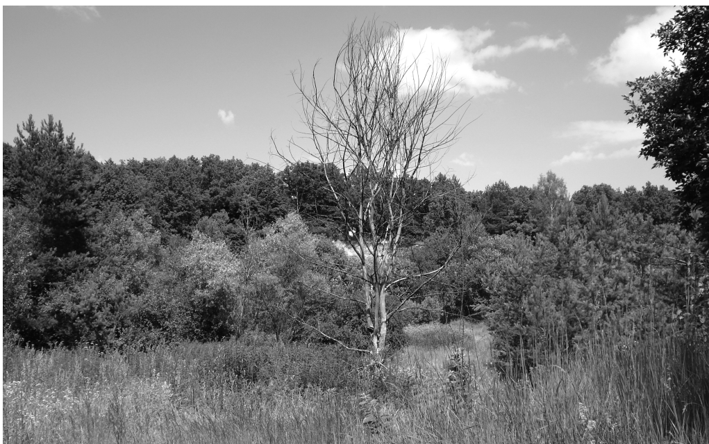
Місце масового розстрілу шуцманів з 136 батальйону біля с. Червоне Глухівського р-ну на Сумщині, страчених нацистами 5 січня 1943 р. за зв'язки з партизанами (фото Т. Пастушенко, 2008 р).