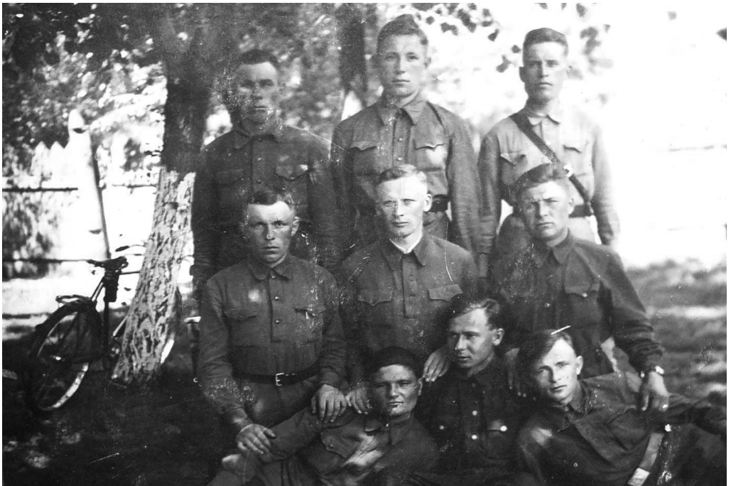
Добровольці «Української роти», що діяли при 552 охоронному батальйоні Вермахту проти партизанів на Сумщині, 1942 р.