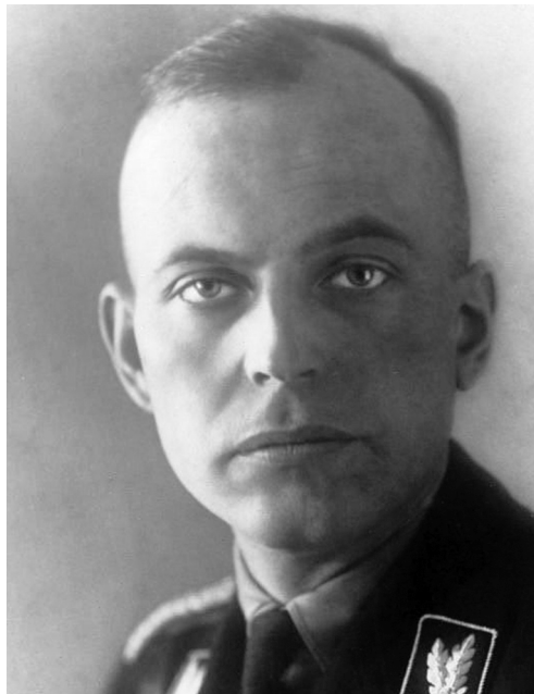
Вищий фюрер СС і поліції «Росія-Південь» Ганс Прюцман (з 1943 — верховний фюрер СС і поліції «Україна»)