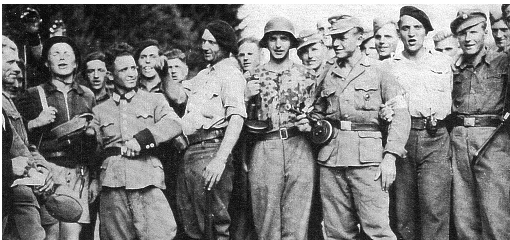
Колишні шуцмани з 115 і 118 батальйонів серед французьких повстанців після переходу на їх бік, 1944 р.