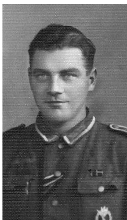
Український доброволець Вермахту, 1944-1945 рр.