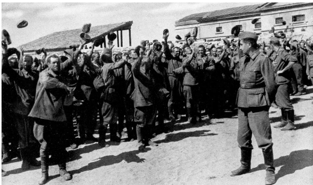
Німецьке пропагандистське фото «Українські полонені радіють звільненню», 1941 р.