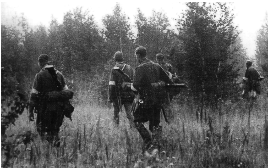
Солдати добровольчого полку «Десна», сформованого на базі 615 українського батальйону, на антипартизанській операції, 1943 р.