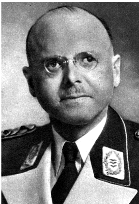
Командувач Вермахту в Україні генерал авіації Карл Кітцінгер