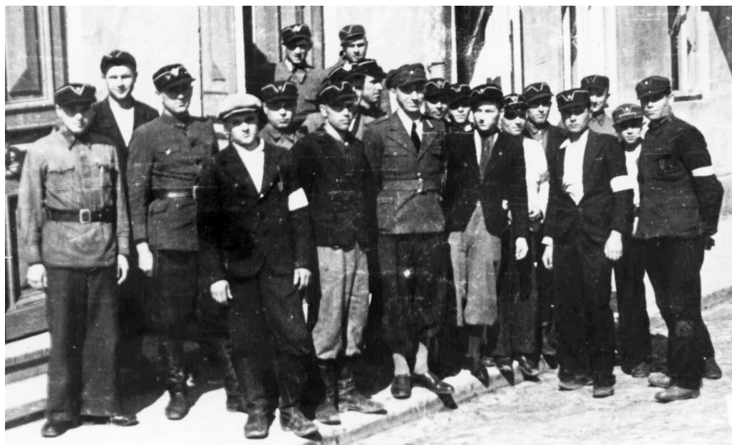
Члени організованої ОУН Української народної міліції м. Рівного, 1941 р.