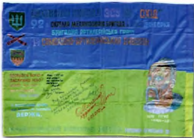
Іл. 2 Державний Прапор України з цитатою В.Вернадського, підписами і побажаннями військовиків ЗС України

92-ї ОМБр та їх рідними розпочалася ще у далекому 2015 р. Також чимало уродженців Харкова та області після початку першого етапу російсько-української війни у 2014 р. захищали Батьківщину в лавах саме цієї бригади. Тож на знак пошани до земляків, в рамках експозиції "Присягу двічі не дають", присвяченій подіям і героям цієї війни, 92-а бригада була представлена чималою кількістю експонатів. На жаль, вексилологічна складова була Ахіллесовою п'ятою експозиції. Відповідно, як тільки з'явилася нагода поповнити колекцію вексилумів цікавими предметами, музей цим скористався.