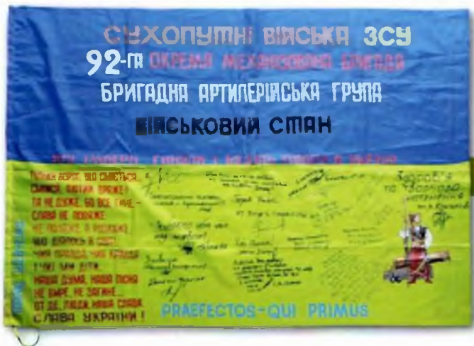
Іл. 4 Державний Прапор України з цитатою Т.Шевченка, підписами і побажаннями військовиків ЗС України

Червоно-чорний прапор з цитатою князя К.Острозького є двобічним прямокутним полотни-