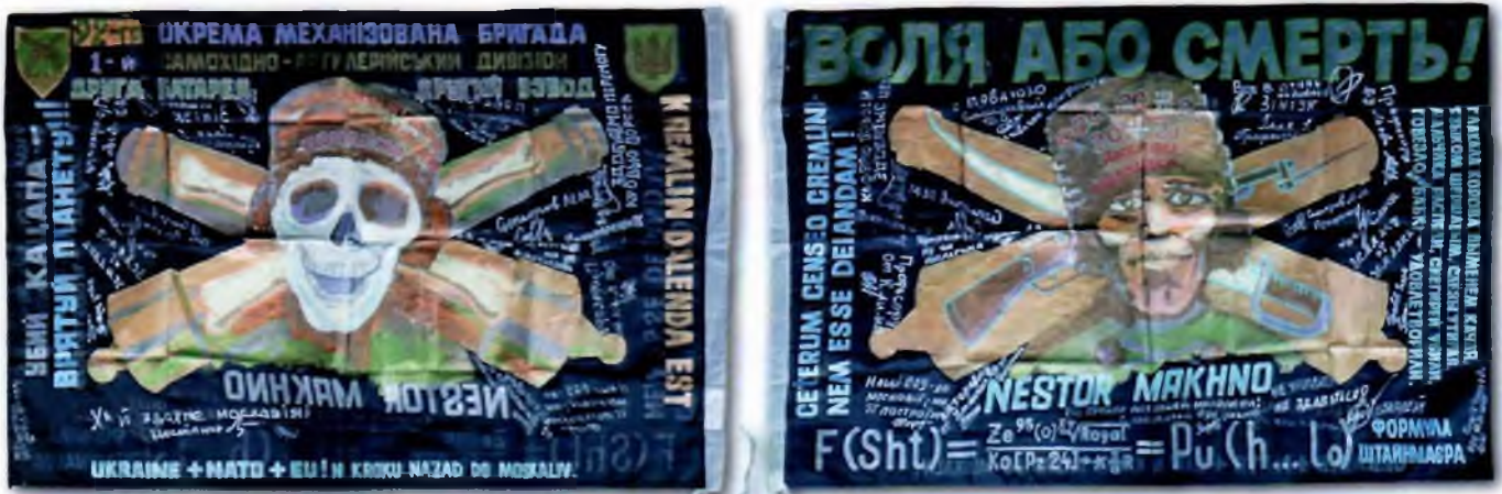
Іл. 5 Прапор чорний з зображенням Н.Махна

щем з напівшовкової тканини розміром 88,1×139 см та складається з двох однакових за розміром фрагментів тканини – червоного вгорі та чорного унизу, зшитих між собою по горизонталі (іл. 3). На верхній червоній смузі побажання та підписи бійців ЗС України, написані чорним фломастером. Також у правій частині даної смуги розташовано напис золотавого кольору у чотири рядки: “ДЕРЕВО СВОБОДИ ТРЕБА / ПОЛИВАТИ ЧАС ВІД ЧАСУ / КРОВ’Ю ПАТРІОТІВ / І ТИРАНІВ...”. Під ним напис сріблястого кольору у два рядки: “ТОМАС ДЖЕФФЕРСОН 1743–1826 / ТРЕТІЙ ПРЕЗИДЕНТ США (1801–1809)”. У центральній частині нижньої чорної смуги напис у сім рядків, виконаний блакитною, золотавою, бузковою та світло-брунатною фарбами: “СУХОПУТНІ ВІЙСЬКА ЗСУ / 92-га ОКРЕМА МЕХАНІЗОВАНА БРИГАДА / ІМЕНІ КОШОВОГО ОТАМАНА ІВАНА СІРКА / БРИГАДНА АРТИЛЕРІЙСЬКА ГРУПА / НА ДИЯВОЛА – ХРЕСТ, НА ВОРОГА – МЕЧ / КНЯЗЬ КОСТЯНТИН / ОСТРОЗЬКИЙ 1460–530”. Ліворуч від напису зображено загальновійськову нарукавну емблему ЗС України у вигляді трикутного щита, в якому на зеленому полі золотавий Тризуб. Праворуч від напису зображення нарукавної емблеми 92-ї ОМБр – трикутний щит зі зеленим полем, в його нижній частині зубчаста фортешна стіна брунатного кольору і над нею схрещені золотаві рушніці. Під цією емблемою зображення двох схрещених старовинних гарматних стволів брунатного кольору.