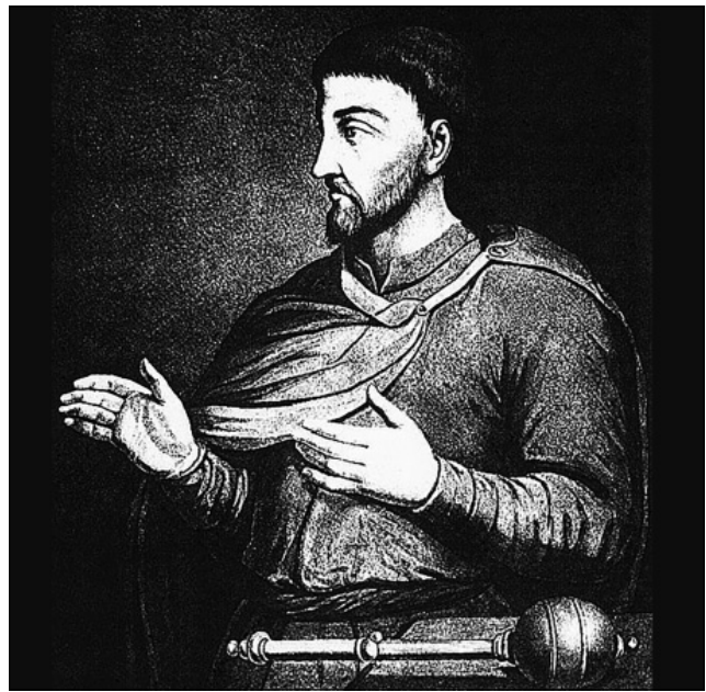
Рис. 1. Гетьман Дем'ян Многогрішний (Ігнатович)

Цією ж статтею містам, розореним російським військом під час повстання І. Брюховецького, надавалися пільги щодо поборів: Переяславу, Ніжину, Любечу, Воронежу, Кролевцю,