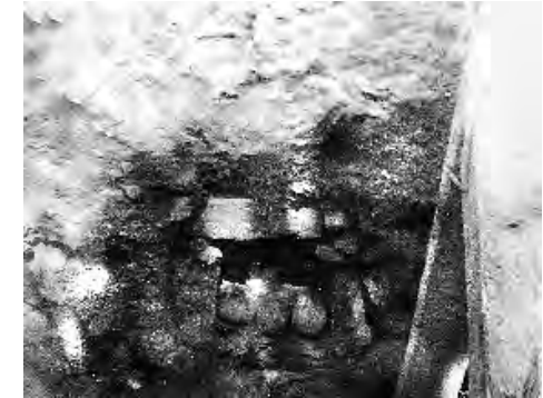
Рис. 2. Закладна плита парного поховання з нішею та різними типами хрестів.

У своїй більшості поховання були безінвентарними, що загалом дозволило вважати їх середньовічними. Однак доброю датувальною ознакою є наявність скляних браслетів. Під час дослідження середньовічного некрополя на північному та північно-східному схилі Мітрідату впродовж 1958–1959 років співробітники музею зафіксували 13 скляних браслетів. Відрізняючись стилем та формою, вони мали багато спільних рис (спосіб виробництва та матеріал