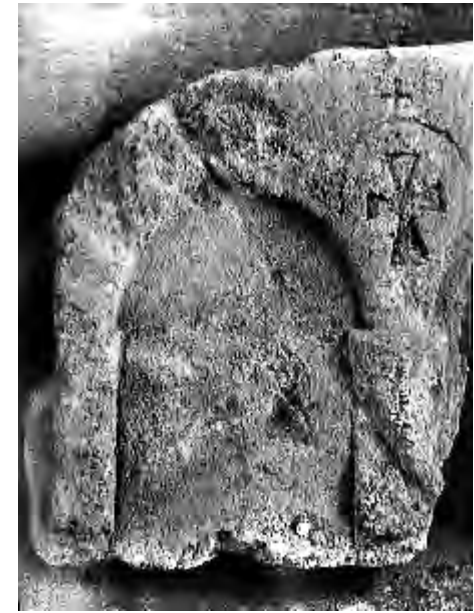
Рис. 1. Закладна плита з нішею та хрестом.

Особливу увагу керченські археологи звернули на збір матеріалів VIII–XIII ст. Значною нагодою для цього стало прокладання міських комунікацій у центральній частині Керчі. Упродовж травня–грудня 1956 р. науковий співробітник КІАМ С. Лев (Берзіна) спостерігала за прокладанням водопроводу вздовж вул. Леніна, Я. Свердлова, К. Лібкнехта, В. Дубиніна та у Дмитрієвському провулку. Згодом, від червня до липня 1959 р., у результаті широкомасштабного прокладання міської теплоцентралі на вул. Я. Свердлова співробітники музею зібрали величезну кількість матеріалу – близько 2,5 тисяч артефактів. Проте до колекційного опису з огляду на важливість вивчення життя