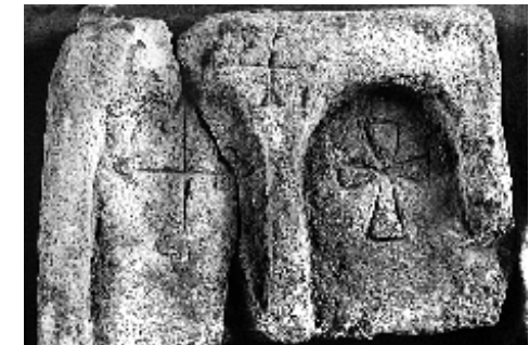
Рис. 3. Колективне поховання (вул. Леніна, 1956 р.)