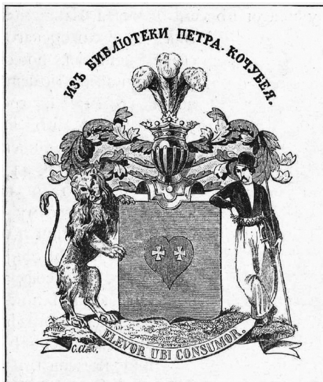
Рис. 2. Екслібрис Петра Аркадійовича Кочубея. Худ. Клодт. II пол. XIX ст.