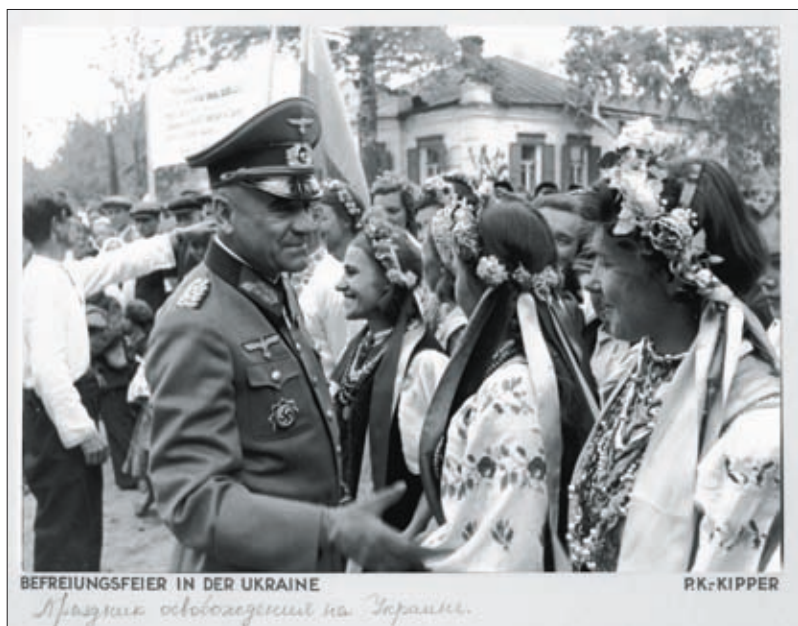
«Праздник освобождения на Украине» 1 . 1941 г. РГАКФД. Оп. 3, № 264, сн. 61. Фотограф Киппер