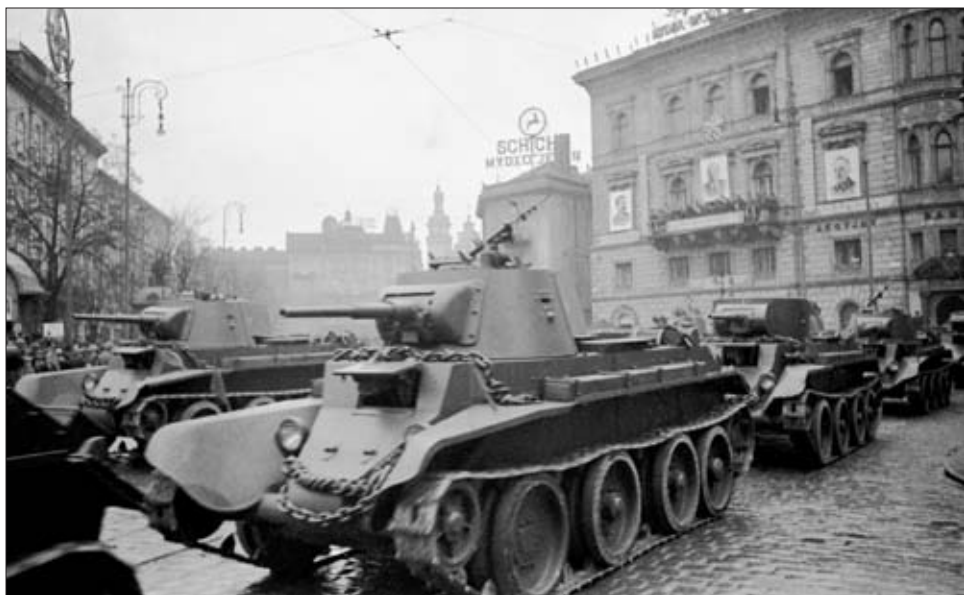
Парад частей Красной Армии в день празднования 22-й годовщины Октябрьской революции в г. Львова. 7 ноября 1939 г. РГАКФД. Арх. № 0-258746. Фотограф Б. Петрусов