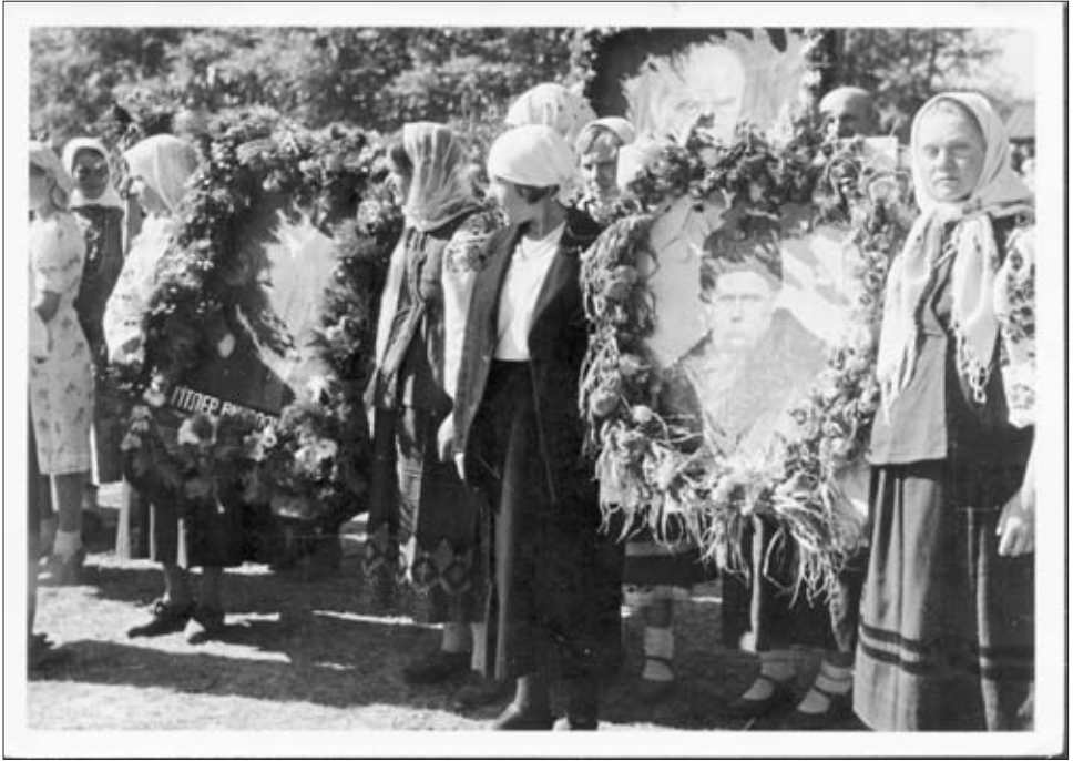
Торжественное шествие с портретами А. Гитлера и Т. Шевченко в г. Конотопе. Сентябрь 1942 г.