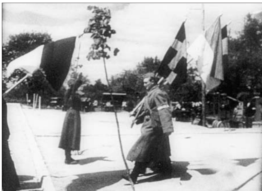
Украинские националисты на марше. Июль 1941 г. Госфильмофонд России. № 23639, ч. 2. Стоп-кадр из Германского киножурнала «УФА» № 518