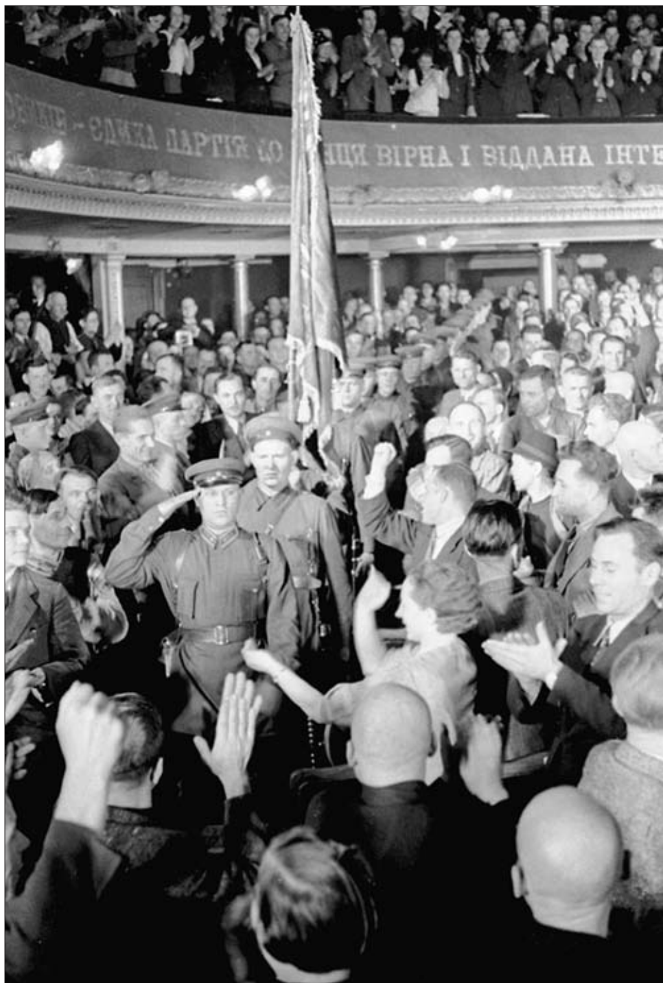
Делегация Красной Армии в зале заседания Украинского национального собрания. г. Львов. Октябрь 1939 г.