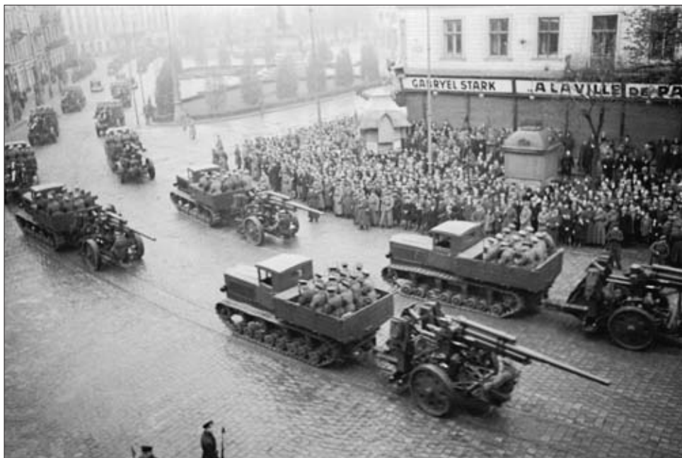
Красная Армия на улицах г. Львова. Сентябрь 1939 г. РГАКФД. Арх. № 4-22905