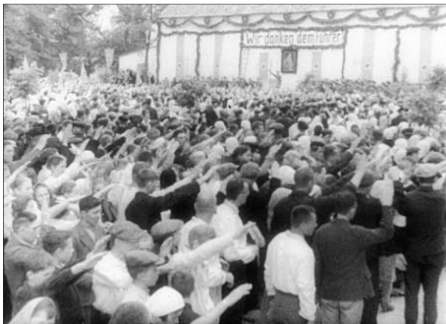
Население приветствует министра по делам оккупированных территорий А. Розенберга в г. Киеве. 1942 г. Госфильмофонд России. № 24434, ч. 1. Стоп-кадр из Германского киножурнала «Остланд»