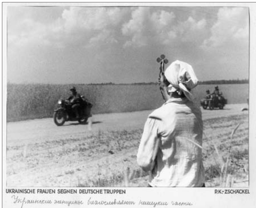
«Украинские женщины благословляют немецкие части». 1941 г. РГАКФД. Оп. 3, № 261, сн. 188. Фотограф Цшекель