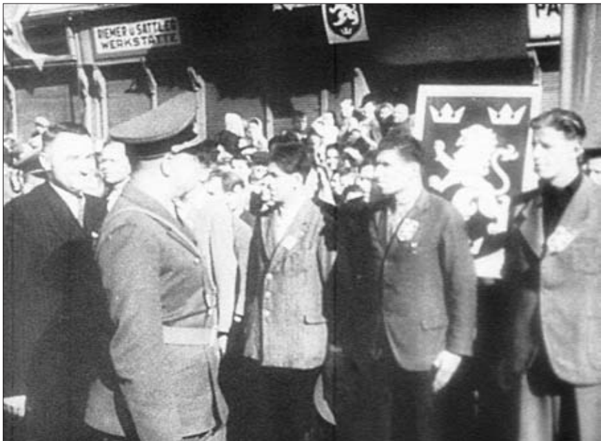
Генерал-губернатор Польши Г.-М. Франк перед строем рекрутов дивизии СС «Галичина» в г. Львове. 1943 г. Госфильмофонд России. № 24159, ч. 2. Стоп-кадр из Германского киножурнала «УФА» № 619/43