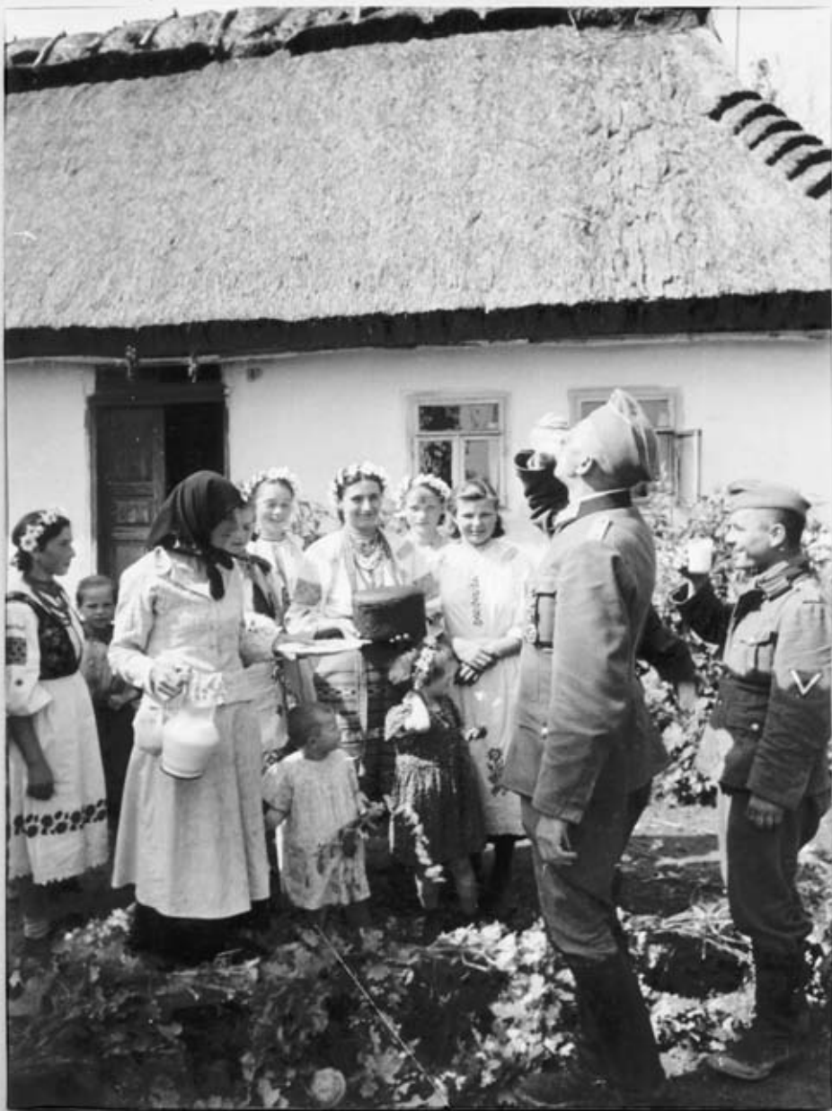
UKRAJNE. HERZLICHER EMPFANG