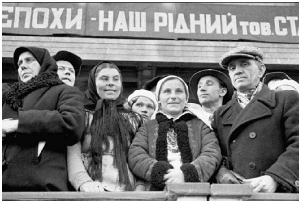
Члены полномочной комиссии Народного собрания Западной Украины на трибуне во время парада в честь воссоединения Украины. г. Киев. 1939 г. РГАКФД. Арх. № 0-103286. Фотограф Б. Козюк