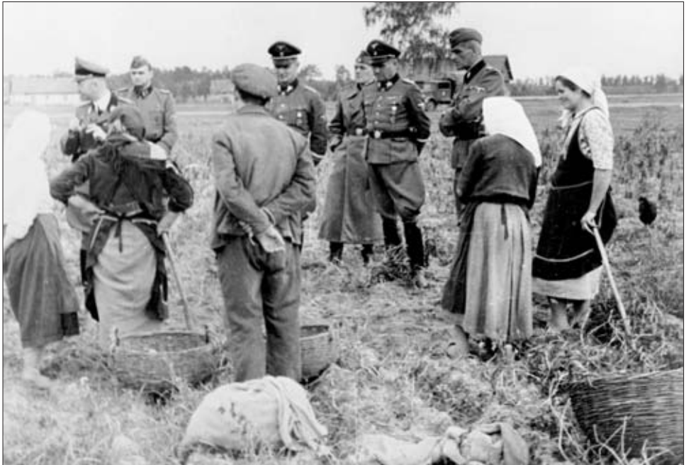
Рейхсфюрер СС Г. Гиммлер с украинским населением. 1942 г. РГАКФД. Оп. 3, № 261, сн. 37. Фотограф Лукас