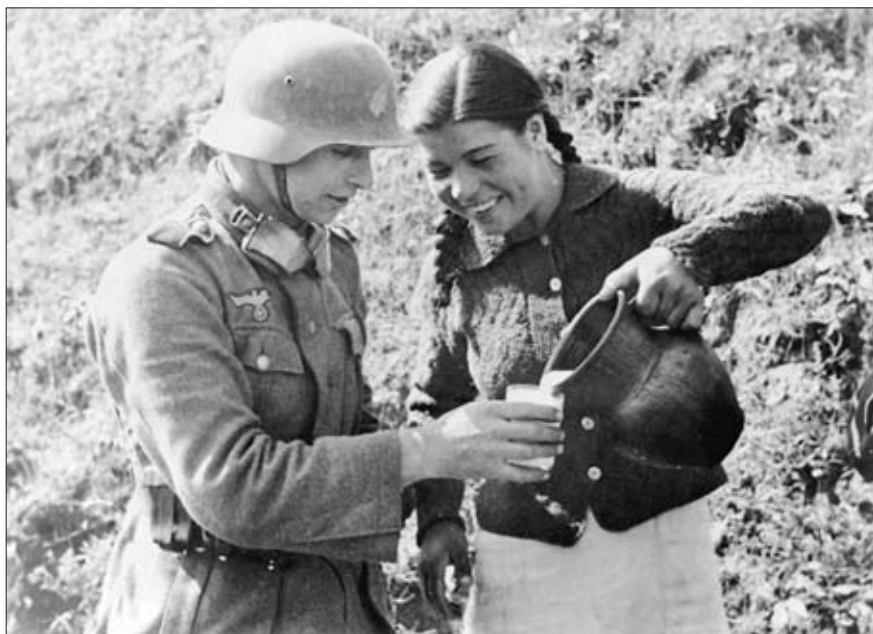
«Украинская девушка наливает молоко немецкому солдату». Октябрь 1941 г. РГАКФД. Оп. 3, № 261, сн. 244