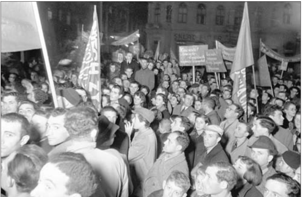
На улицах г. Львова в день празднования 22-й годовщины Октябрьской революции. 7 ноября 1939 г. РГАКФД. Арх. № 0-296639. Фотограф М. Озерский