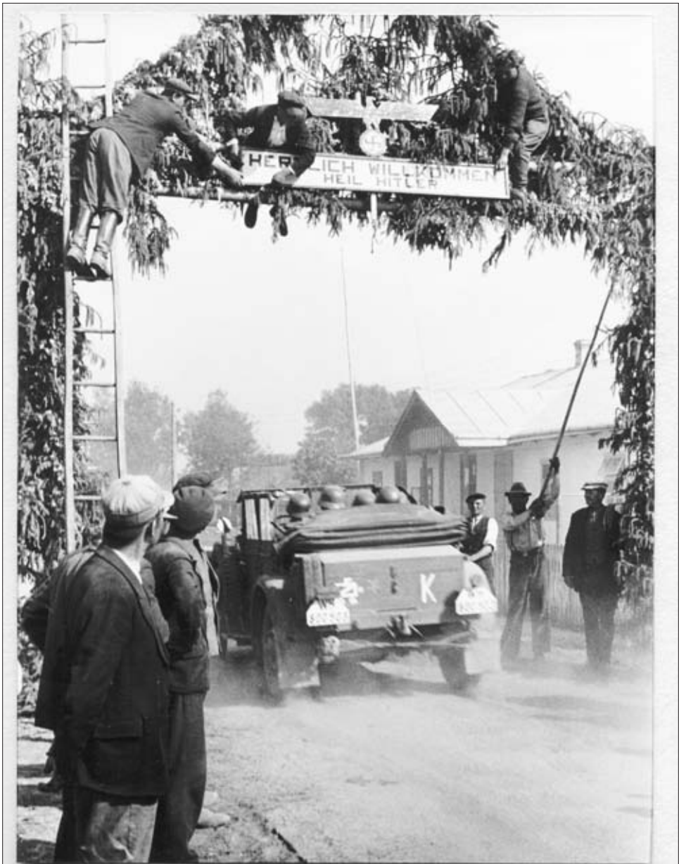
HERZLICHER EMPFANG IN DER UKRAINE