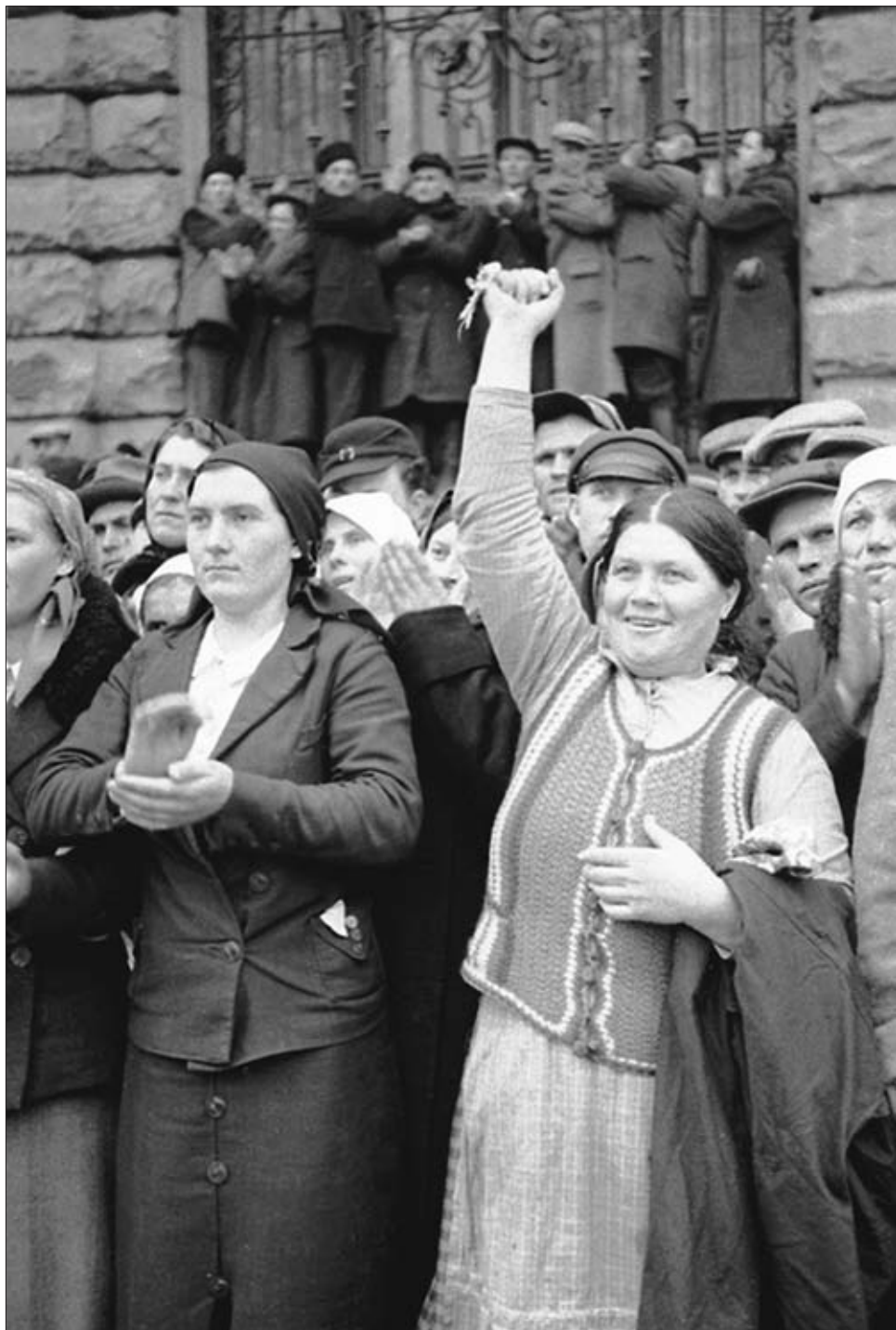
Жители г. Львова приветствуют войска Красной Армии на параде после завершения работы Украинского национального собрания. Октябрь 1939 г. РГАКФД. Арх. № 0-275179. Фотограф П. Новицкий