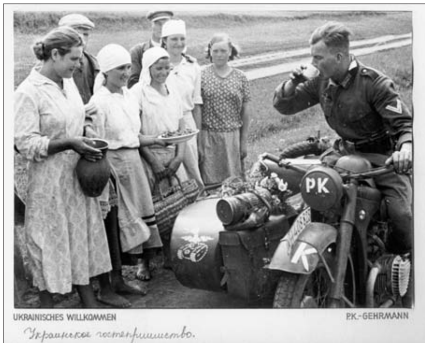
«Украинское гостеприимство». 1941 г. РГАКФД. Оп. 3, № 264, сн. 50. Фотограф Германн