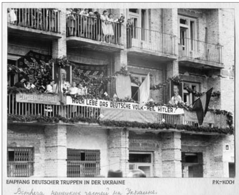
«Встреча немецких частей на Украине». 1941 г. РГАКФД. Оп. 3, № 264, сн. 45. Фотограф Кох