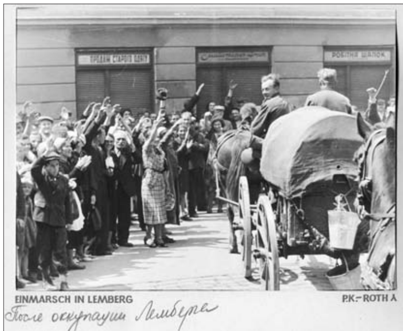
Население г. Львова приветствует немецких солдат. 1941 г. РГАКФД. Оп. 3, № 98в, сн. 5. Фотограф Рот