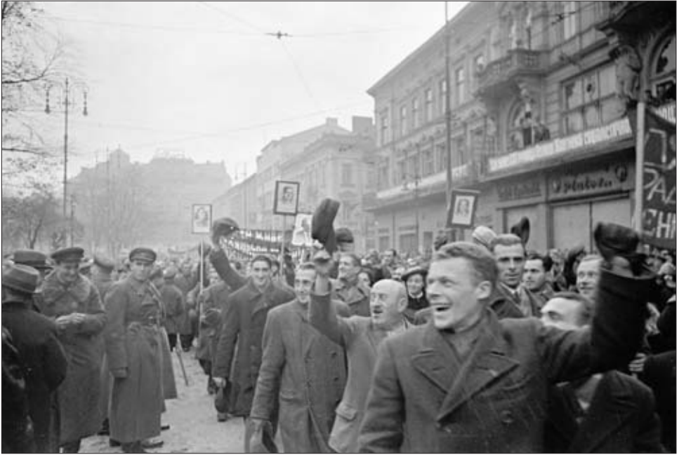
Жители г. Львова на демонстрации в день празднования 22-й годовщины Октябрьской революции. 7 ноября 1939 г. РГАКФД. Арх. № 0-296636. Фотограф М. Озерский