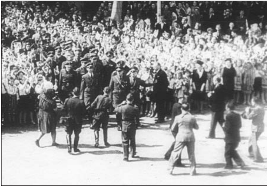
Генерал-губернатор Польши Г.-М. Франк во время посещения г. Львова. 1943 г. Госфильмофонд России. № 24159, ч. 2. Стоп-кадр из Германского киножурнала «УФА» № 619/43