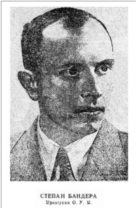
Степан Бандера. Б/д