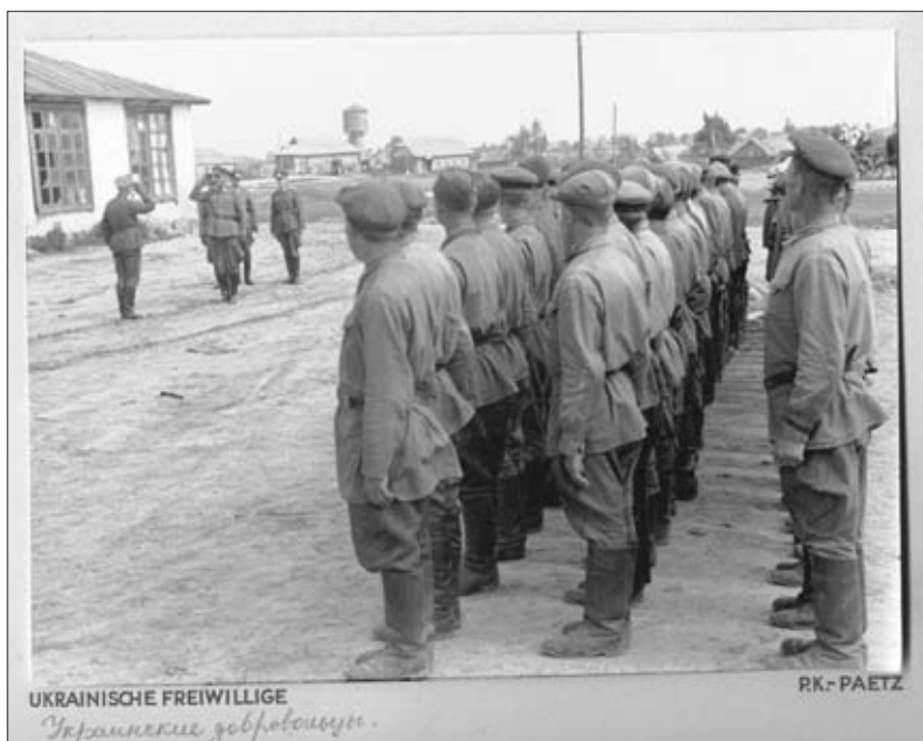
«Украинские добровольцы». 1941 г. РГАКФД. Оп. 3, № 264, сн. 33. Фотограф Пётц