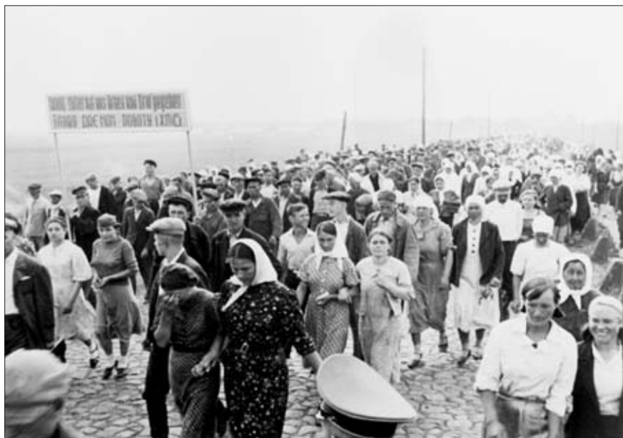
Жители Украины перед отправкой в Германию. 1942 г. РГАКФД. Оп. 3, №261, сн. 81. Фотограф Гримм