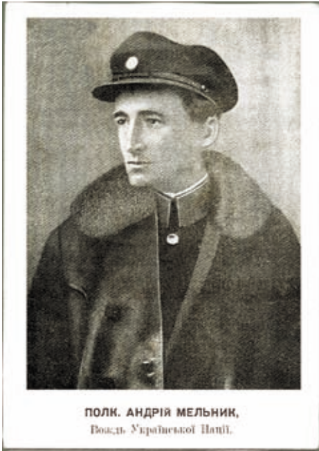
Андрей Мельник. Б/д