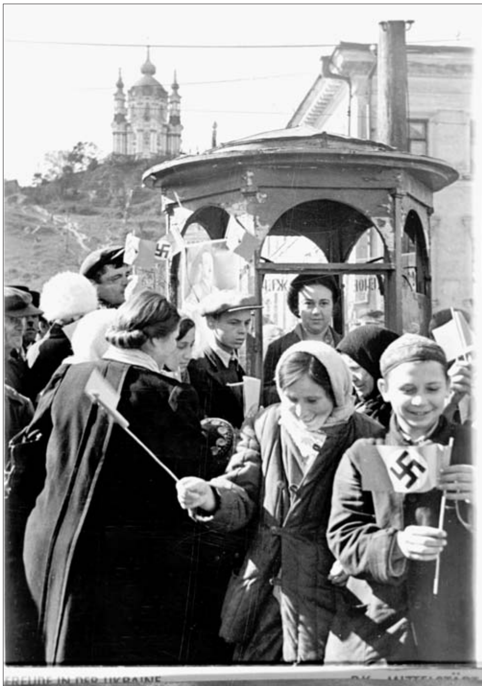
«Радость на Украине». 1941 г. РГАКФД. Оп. 3, № 264, сн. 46. Фотограф Миттельштедт