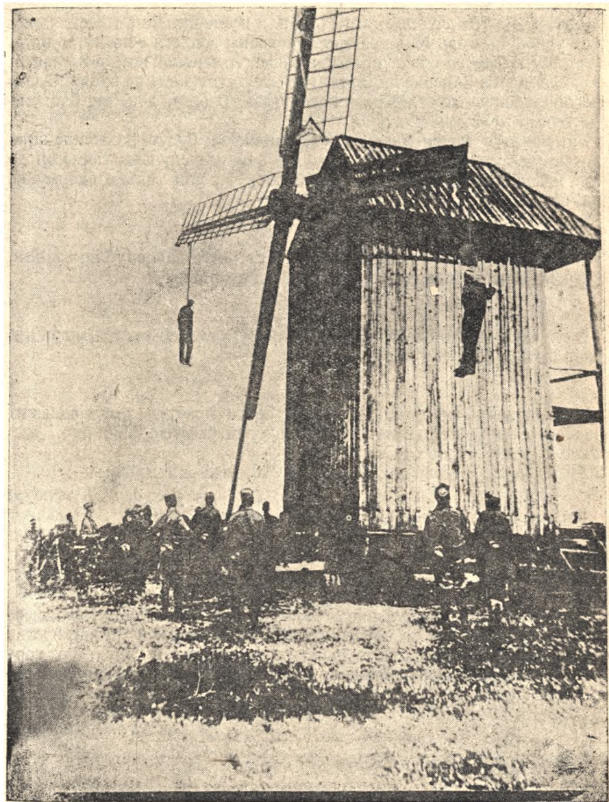
Розправа німецько - австрійських інтервентів над революційними робітниками в селі Канжі