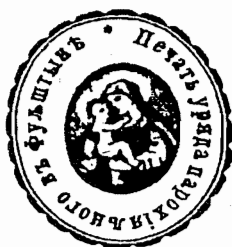
м-ко. Фельштин, 1885 р.