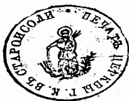
м. Стара Сіль, 1885 р.