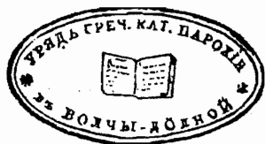
с. Волча Долішня, 1899 р.