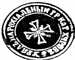
с. Хирів, 1885 р.