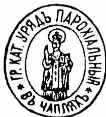
с. Чаплі, 1899 р.