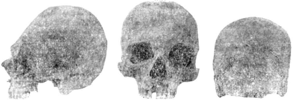
Рис. 2. Навмисно деформований череп. Катакомбна культура (Говоруха, курган 3, поховання 7, кістяк 1).

Два чоловічих черепи з м. Донецька (верхня течія Кальміусу) характеризуються значною масивністю та доліхокранією. Довжина чо-