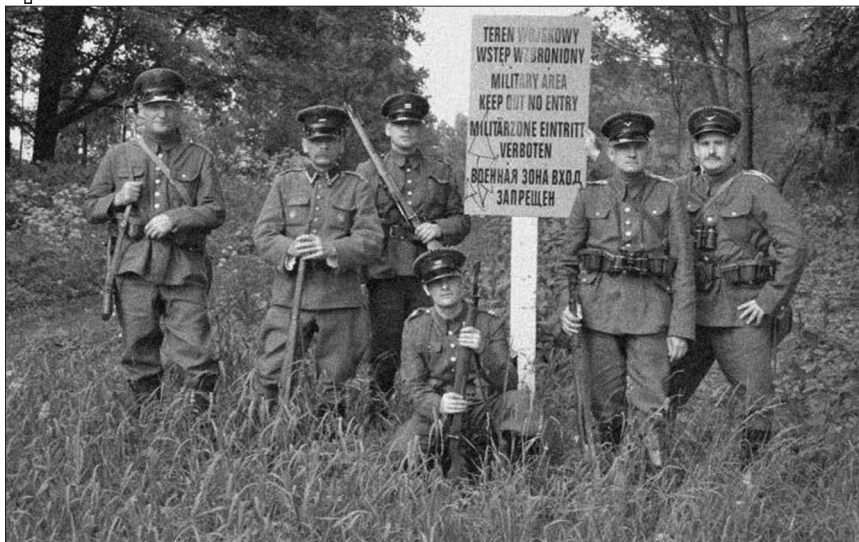
Військовослужбовці польського Корпусу охорони прикордоння, 1938 р.