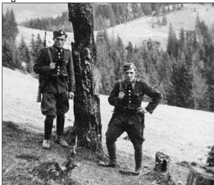
Чехословацькі прикордонники в Карпатах, 1938 р.

ведення спільної диверсійної акції проти Чехословаччини зазнали краху» 77 .