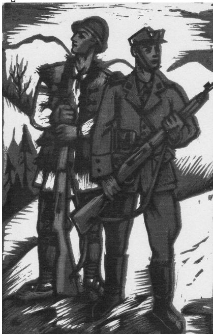
Плакат М. Бутовича, на якому зображено озброєних гвинтівками січового старшину та січовика в цивільному вбранні, які несуть прикордонну службу

Варшаву призупинити акцію «Лом» за наказом командира VI армійського корпусу генерала В. Лянгнера від 25 листопада 1938 р. та розпочати її ліквідацію. Остання тривала до кінця грудня 1938 р., а подекуди й до березня 1939 р. Несподіваний маневр Будапешта означав, що угорський союзник поступився Третьому Райху в питанні встановлення спільного кордону з Польщею й підпав під вплив Берліна.