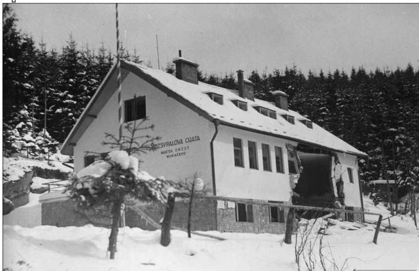
Туристична база «Розсипалова хата» у с. Скотарське на Волівеччині, підірвана внаслідок диверсії польських бойовиків, грудень 1938 р.

ку 1939 р. його змінив П. Курницький). Попри відмову Будапешта пристати на цей план, Варшава не могла, склавши руки, просто пасивно спостерігати за подіями на Підкарпатті. У польському зовнішньополітичному відомстві вважали, що якщо Угорщина не проявить рішучості в карпатоукраїнському питанні з огляду на позицію Берліна, то Польща сама приступить до його вирішення.