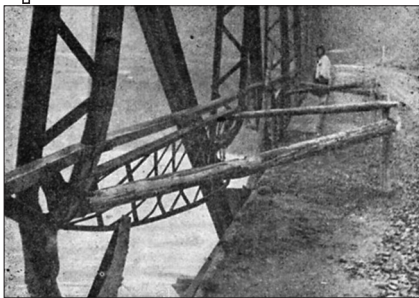
Міст на Чорній ріці біля Торуня, підірваний польськими терористами

оснащених на військовий лад, які мають засилати в Карпатську Україну» 48 .