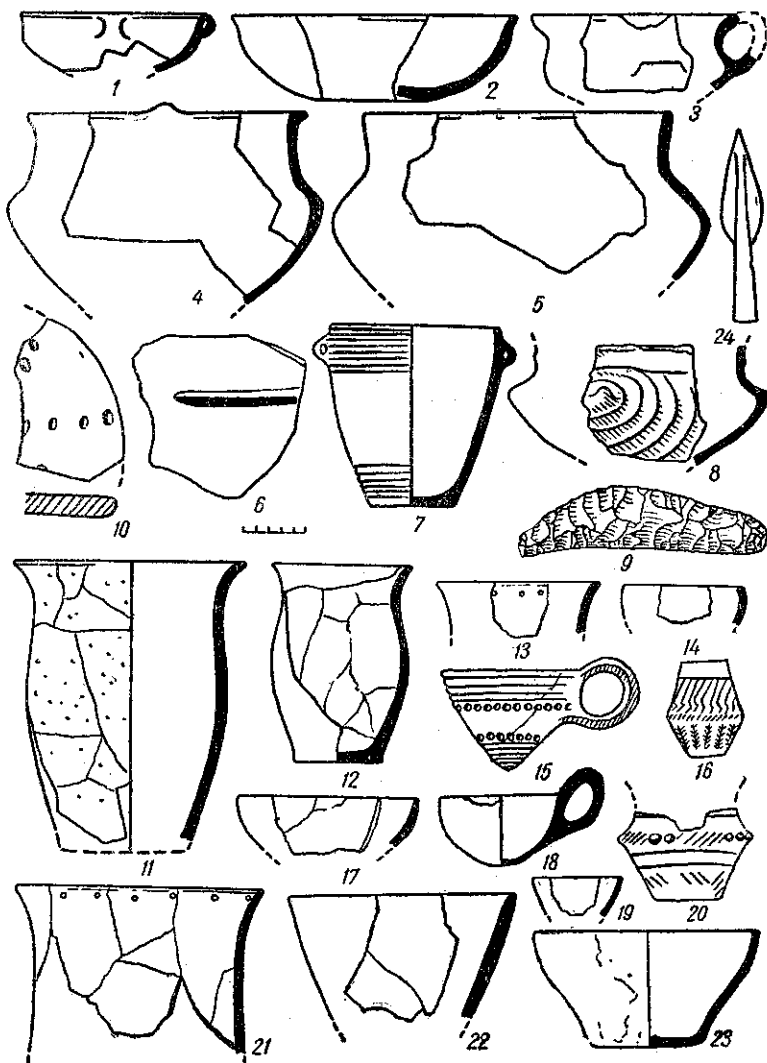
Рис. 1. Матеріали з могильників і поселень лужицької та висоцької культур:

1—4 — кераміка з могильника в Терновиці; 5—8, 10 — кераміка з поселення в Залісках; 9, 13, 14, 24 — матеріали з поселень в Гончарівці; 11, 12, 15—23 — посуд з могильника в с. Конюшків.