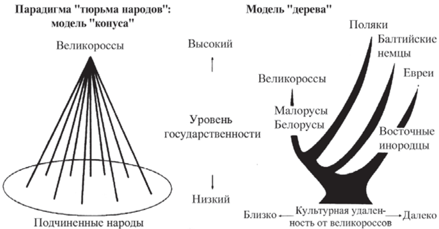
Схема 1. Две модели объяснения этнической структуры Российской империи.

прав, то как могла Российская империя руководить своими западными губерниями, несмотря на низкие технологии управления и социополитическую слабость восточных славян в регионе? На наш взгляд, только использование принципа “разделяй и властвуй” (или “этнического бонапартизма”) было единственно возможным. Царское правительство провоцировало украинских крестьян на борьбу против “польских латифундий” и “еврейского паразитизма”, в то же время успокаивая поляков и евреев, что правительство защитит их от возможных нападений украинских народных масс. Уловки такого рода заставляют усомниться в наличии последовательной глобальной тенденции в царской национальной политике (например, переход от административной ассимиляции, относительно толерантной, к культурной ассимиляции, более жесткой; или от либерализма Александра II к реакции Александра III). Ведь подавление одной этнической группы