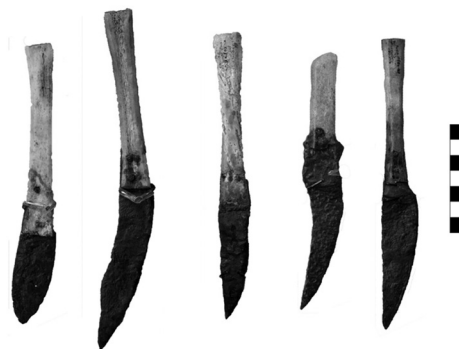
Рисунок 3. Ножі після реставрації.