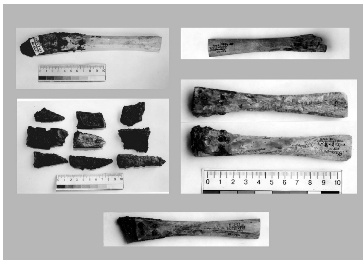
Рисунок 1. Ножі до реставрації.

Частина предметів за станом збереження надійшла до науково-допоміжного фонду, серед них фрагменти п'яти залізних ножів з горбатими спинками 1 . Леза чотирьох ножів (інв. № БД-4991/1, БД-4991/2, БД-4991/3, БД-4991/4) були у вигляді дрібних фрагментів. У суцільних кістяних руків'ях ножів збереглися залишки залізних клинків, довжиною 3 см, та залізних штифтів, якими клинок прикріплювали до кістяних руків'їв. У руків'ї п'ятого ножа (інв. № БД-5016) збереглася майже половина клинка (рис. 1). У 1970-х роках відомий археолог Б. Шрамко провів серію металографічних аналізів скифських ножів, у результаті яких було з'ясовано, що різні типи ножів виготовлені за різними технологіями. Найбільш складними за технологією виготовлення виявилися побутові ножі з дугоподібною спинкою та прямим лезом 2 .