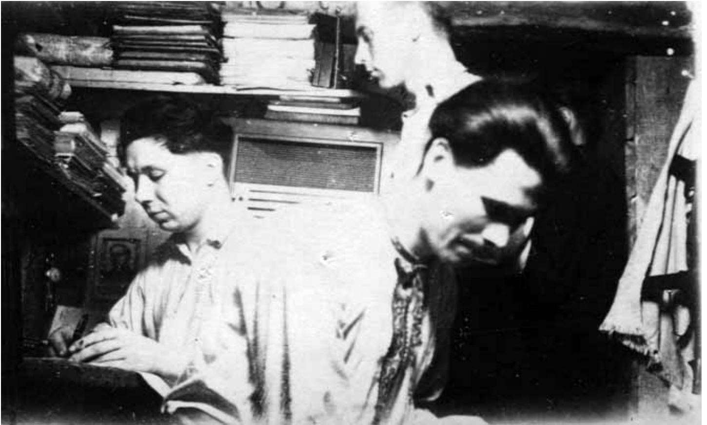
Підпільники ОУН працюють в бункері. Хмельницька область, 1950 р.

на другий план, бо інакше може статися катастрофа 25 . Очевидно, Р. Шухевич мав на увазі те, що якщо ОУН не зуміє завоювати довіру всього українського народу, то не отримає належної підтримки. Відповідно, без неї рано чи пізно радянські каральні органи розгромлять ОУН у західних областях України і покладуть край українському національно-визвольному руху.