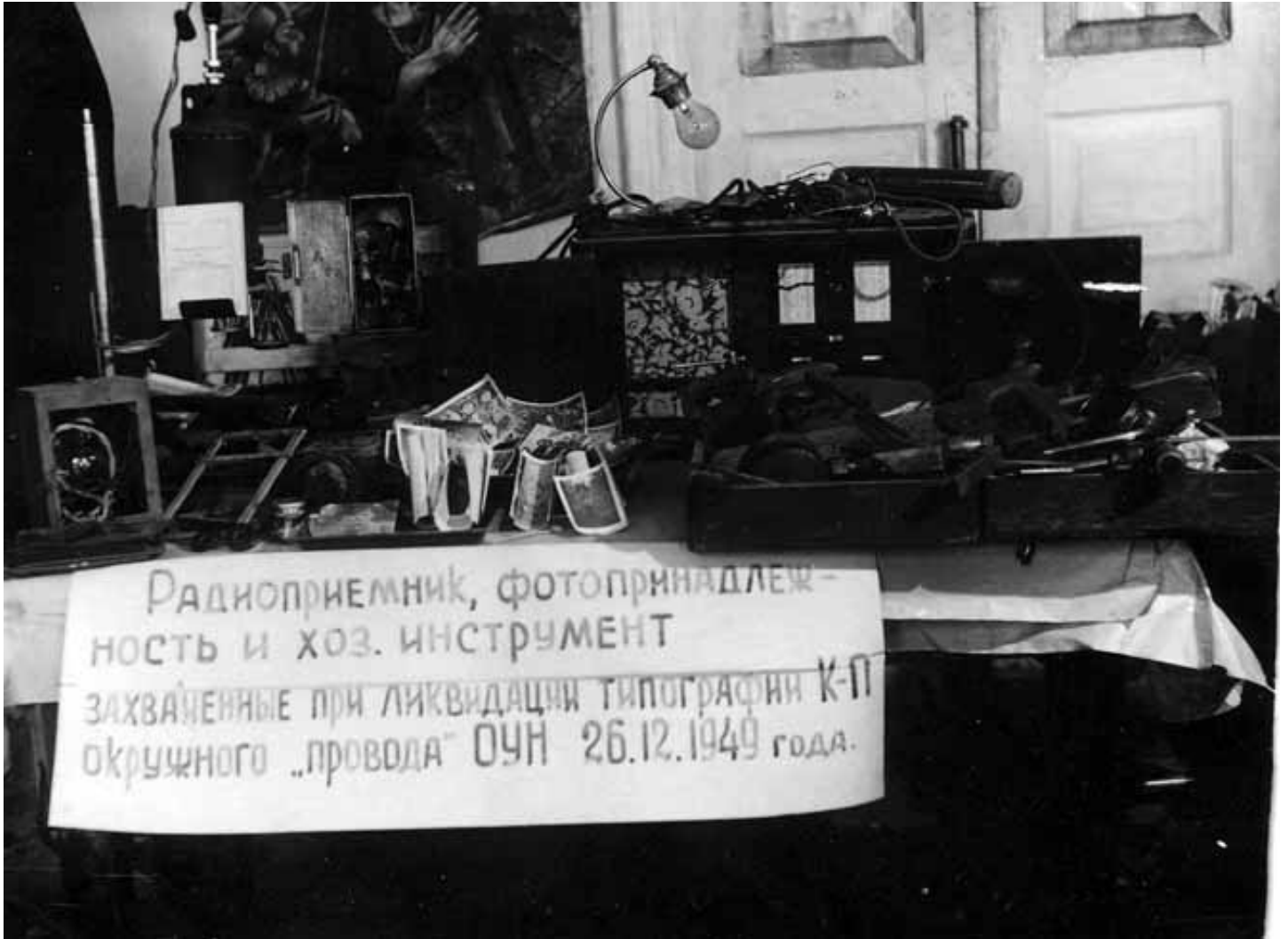
Майно типографії ОУН Кам'янець-Подільського окружного проводу ОУН