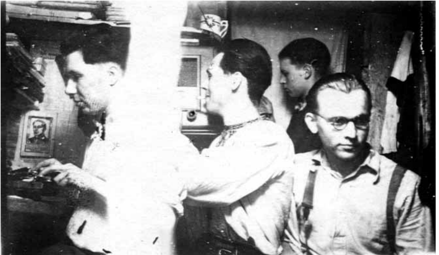
Кременецький надрайоновий провідник «Алас» та інші підпільники в бункері. 1950 р.

були залякані та сумнівались у перемозі ідей ОУН, порівнюючи сили ОУН і радянської влади 39 .