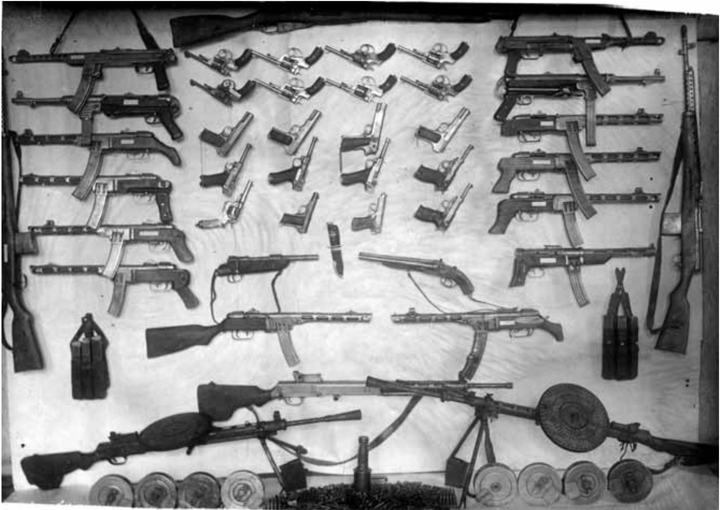
Частина зброї, яку співробітники МГБ вилучили в учасників ОУН Кам'янець-Подільського окружного проводу ОУН у 1950—1952 рр.

час, слід констатувати, що, незважаючи на сподівання керівників ОУН(б), націоналістична ідеологія не отримала масової підтримки східноукраїнського населення, яке протягом 1914—1945 рр. пережило дві світові та громадянську війни, два голодомори та сталінський терор. Варто відзначити, що російськомовних українців відлякувала не лише небезпека арешту за подібну діяльність, але й радикальні заклики ОУН на кшталт «Україна для українців!»