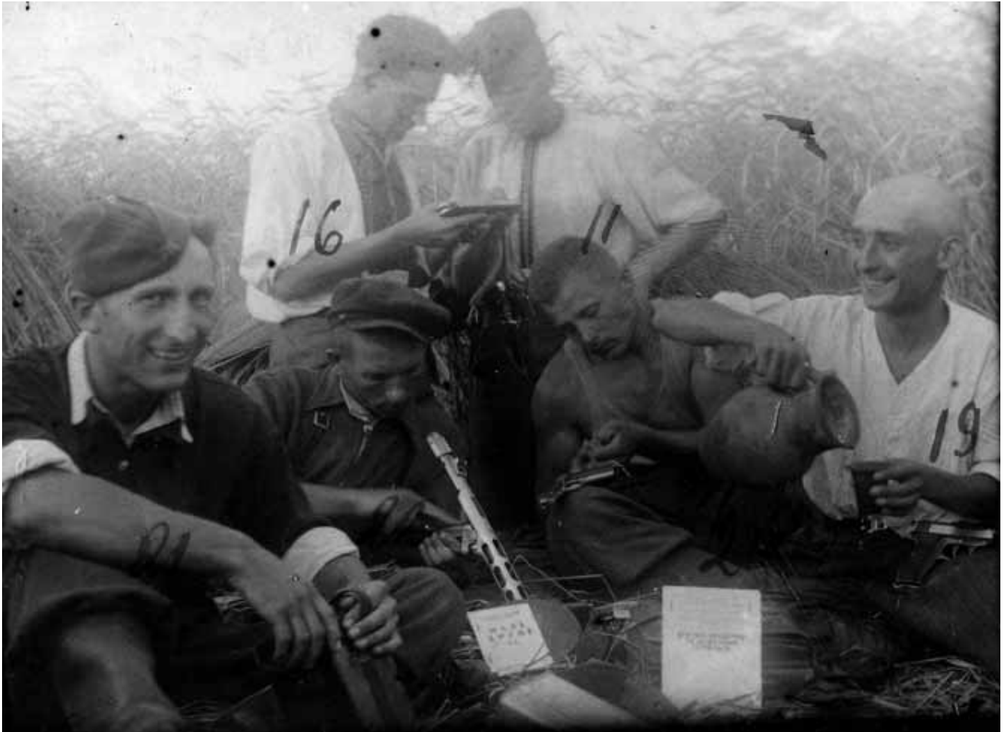
Підпільники з Кам'янець-Подільського окружного проводу ОУН