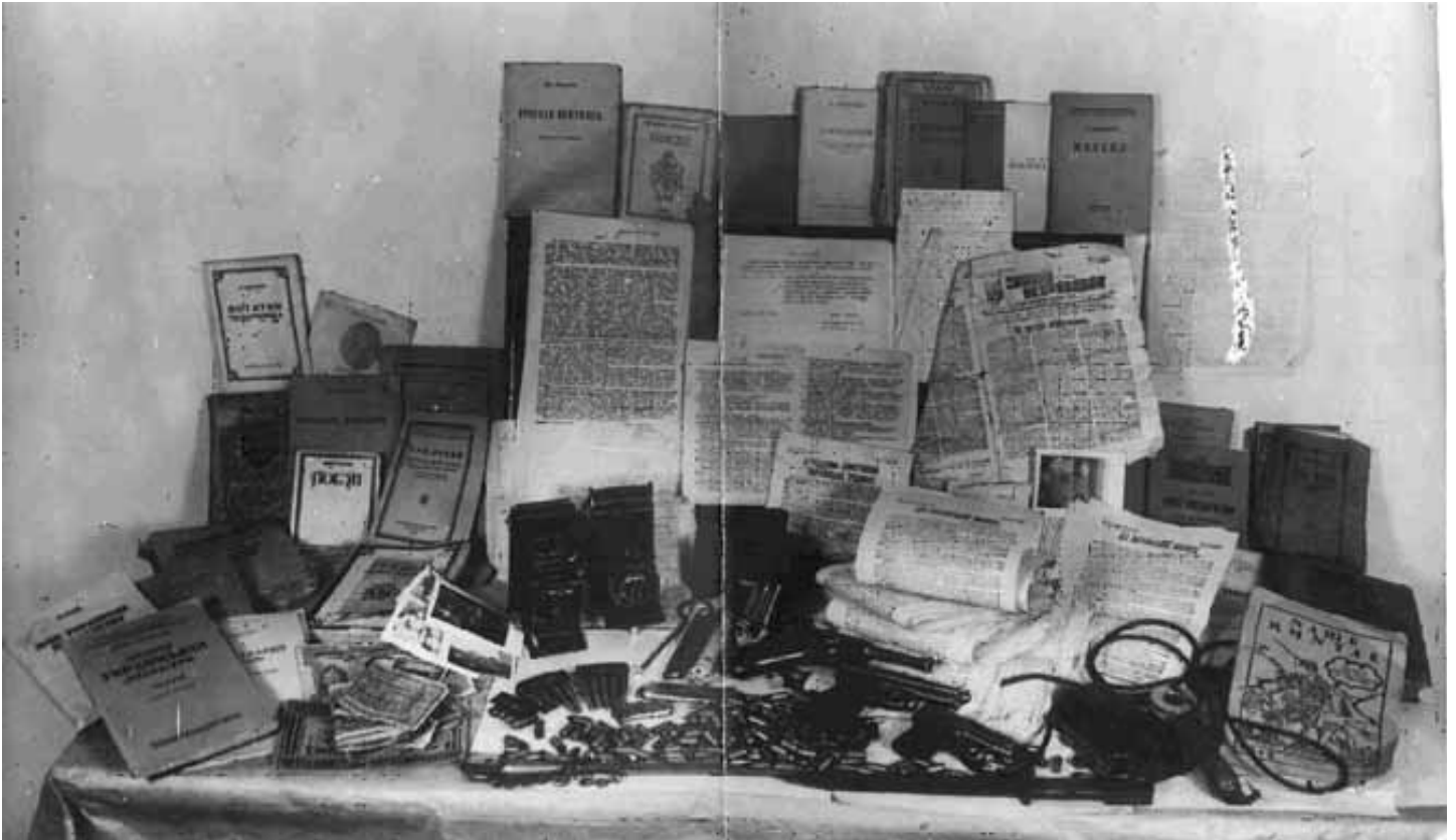
Література, листівки, зброя та інші речі, вилучені в учасників Київської молодіжної ланки ОУН 1948 р.

Підсумовуючи результати дослідження діяльності ОУН(б) в Центральній та Східній Україні, варто зазначити, що найактивнішою вона була за часів німецької окупації в 1941—1943 рр. Саме тоді ОУН(б) вдалося здобути певний авторитет серед молоді. Можливо, це пов'язано з тим, що німці, перебуваючи у стані війни з СРСР, не мали можливості приділити достатньо уваги розгрому підпілля на контрольованих територіях. З іншого боку, частина місцевого українського населення в надії на кращу долю співпрацювала і з німцями, і з ОУН.