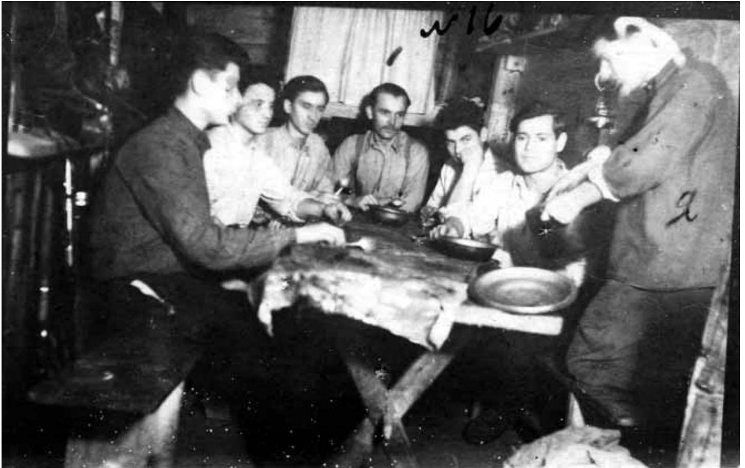
Керівник Кременецького надрайонового проводу ОУН проводить вишкіл з молоддю. 1950 р.

антирадянською 41 . На початку 1990-х рр. усі учасники цієї ланки ОУН були реабілітовані.