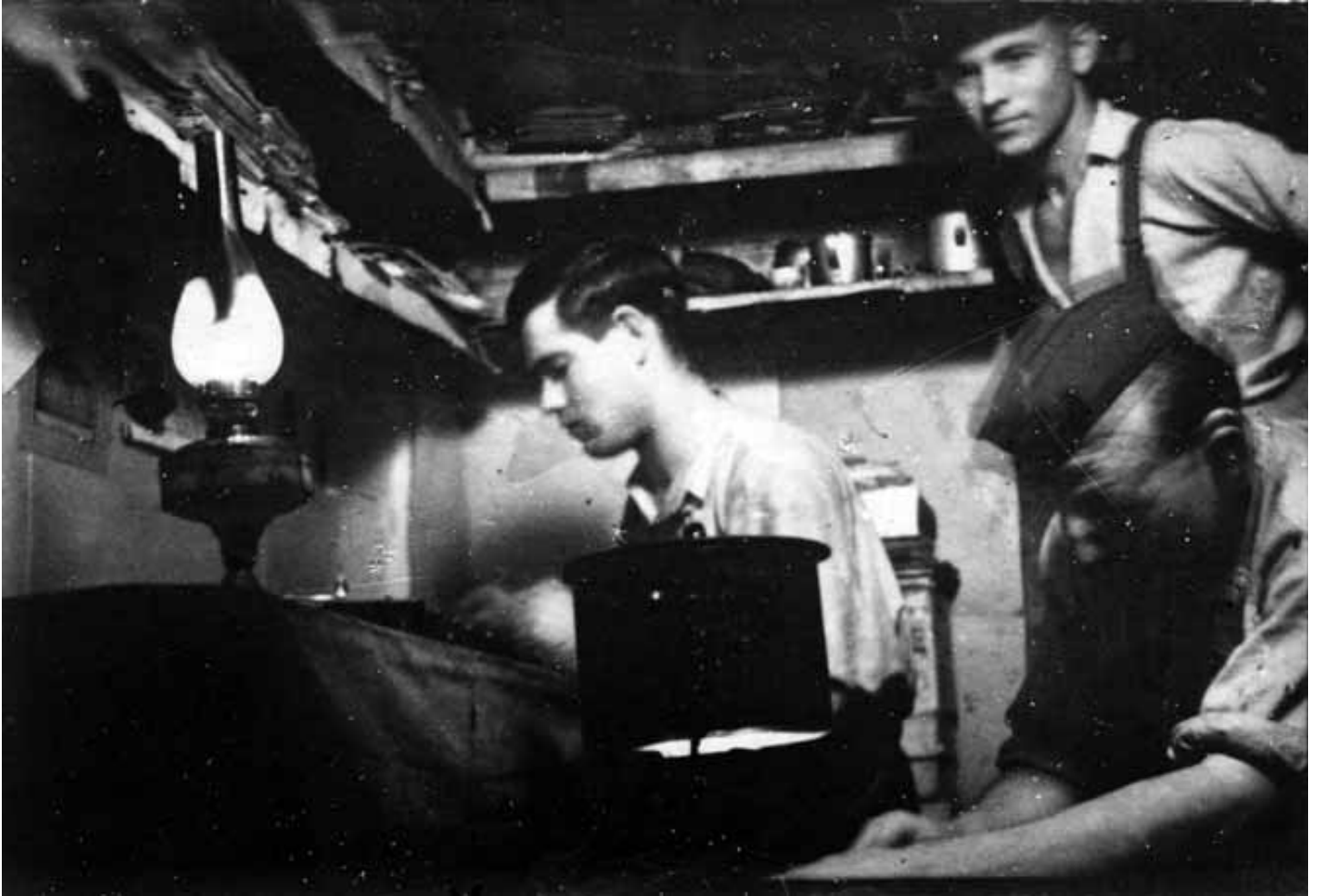
Підпільники ОУН працюють в бункері. Хмельницька область, 1950 р.

ся з українцями-східняками, переважно молоддю, та підкидали листівки й літературу в потяги, надсилали їх у листах робітникам.