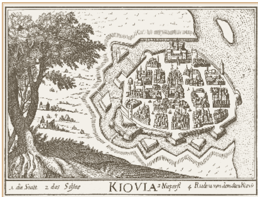
Киев. Немецкая гравюра XVII в.