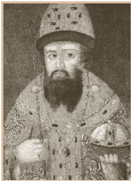
Михаил Федорович Романов. Изображение XVII в.

распространился слух, что с польской армией на Украину идет большое количество немцев, которые будут поселены «на козачьих местах», когда «польские люди побьют казаков» 43 .