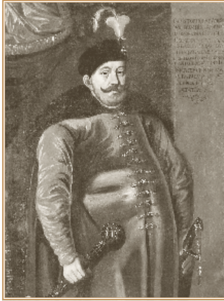
Кшиштоф Радзивилл. Портрет XVII в.

жием защищать «веру греческого закона» и что у него «ссылка о вере з запорскими черкасы, что им стоять о вере на полских людех вместе» 48 . Распространялись слухи, что благодаря действию дружественных сил будет созван сейм, где «с Литвою Русь о вере помирятца», и «русские» земли в Речи Посполитой будут отданы в управление королевичу Владиславу 49 . В 1625 г. Владислав находился в заграничном путешествии, но ходили слухи, что королевич «писал из Цысаревы земли, чтоб черкасы збирались нынешняго лета в Стародуб, а от него ждали вестей» 50 .