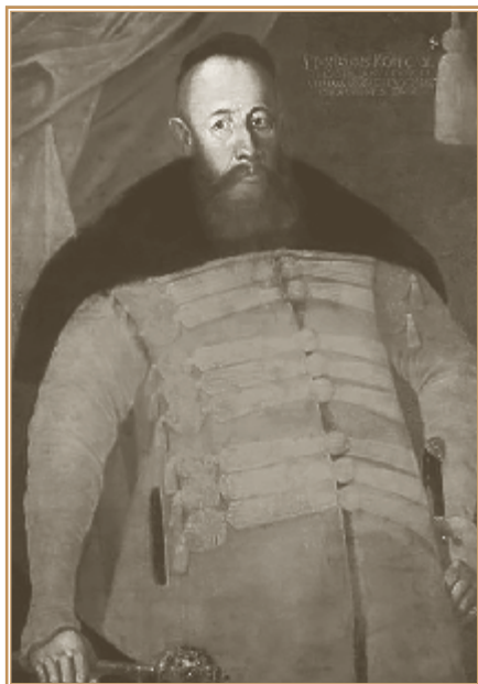
Станислав Конецпольский. Портрет XVII в.

На эти предложения русское правительство, как известно, не дало положительного ответа. Если просьба о предоставлении убежища была удовлетворена, то относительно просьбы о военном вмешательстве в ответе говорилось: «ныне царскому величеству того дела всчати нельзя, потому, что у вас еще о том укрепенья нет» 13 . Смысл этого высказывания понятен. Предлагая оказать помощь казачеству в его войне с властями Речи Посполитой, киевский посол не представил каких-либо документов, которые бы исходили от казачества и содержали его просьбы о помощи. К тому же, как выяснили у епископа его собеседники, «Войско Запорожское идет на весну на турецкого морем» 14 . Кого бы тогда могло поддержать пришедшее на Украину русское войско?