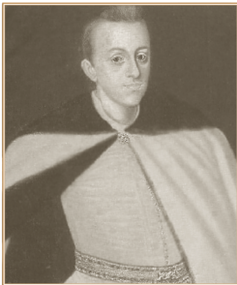
Владислав Ваза в юности. Портрет начала XVII в.

Имя Олифера Голуба появилось здесь не случайно. Избранный в гетманы «черню» после смерти Сагайдачного, он был одним из главных руководителей восстания 1625 г. 27 Он не принял условий Куруковского мира и зимой 1625/26 г. во главе четырехтысячного отряда казаков ушел в Крым 28 . Предложения Борецкого опирались на хорошее знание настроений в казачьей среде, но уход Олифера Голуба в Крым говорит о том, что осуществлены они не были.