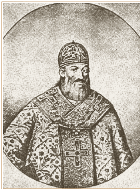
Митрополит Иов Борецкий. Изображение XIX в.

вославленной иерархии в Киевской митрополии в 1620–1621 гг. произошло при активной поддержке казачества и вопреки желанию властей Польско-Литовского государства. Уже в марте 1621 г. последовали распоряжения об аресте новых православных иерархов. Они подлежали аресту, как посвященные в сан агентом османов — иерусалимским патриархом, чтобы во время войны между Речью Посполитой и Османской империей вызывать в стране волнения, как шпионы и нарушители порядка 2 . В таких условиях православные митрополит и епископы вынуждены были находиться в Киеве, по выражению Иова Борецкого, «криющихся под крыле христоролюбивого воинства черкасских молодцов» 3 , то есть казаков. Понятно, какими опасностями грозил для этого круга лиц поход польской армии на Украину.